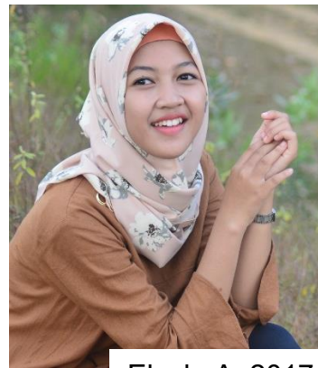
Eleck, A. 2017.