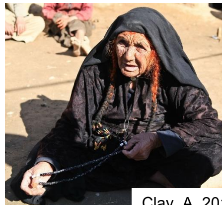
Clay, A. 2012.