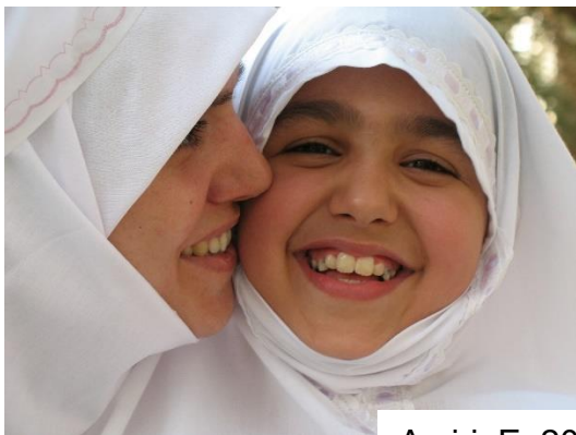
Amiri, E. 2014

Kerro jotain näistä tytöistä ja naisista.