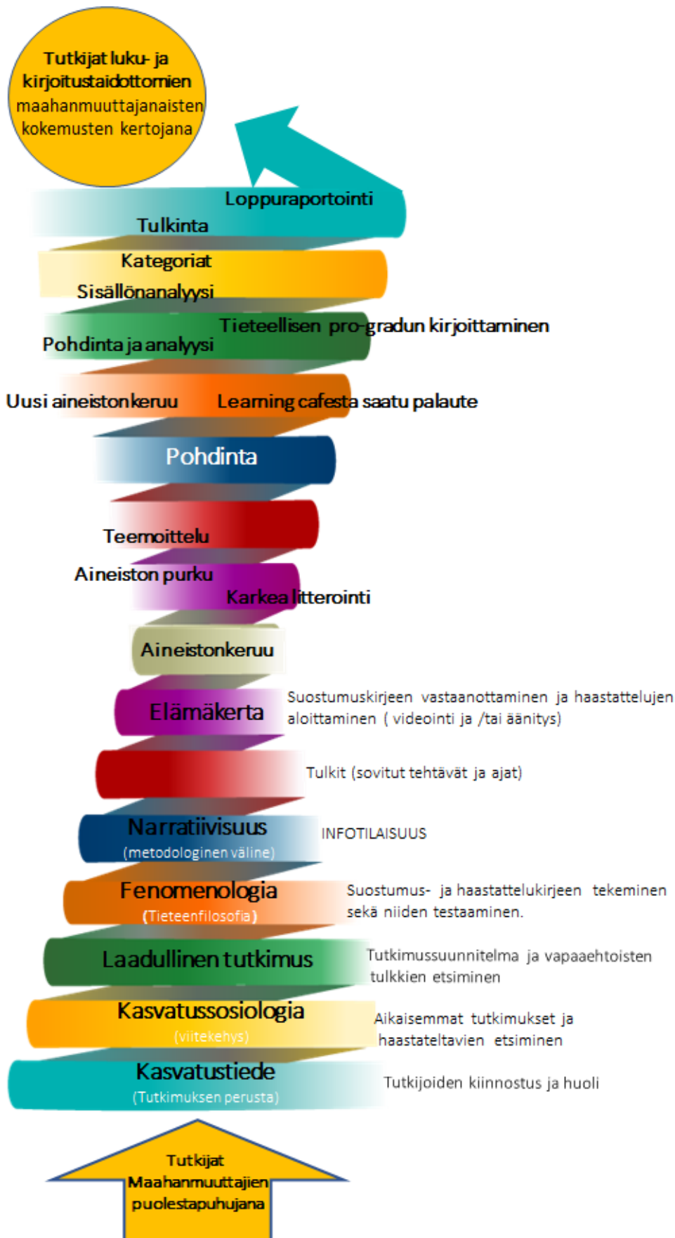
Kuvio 1: Tutkimusvaiheet