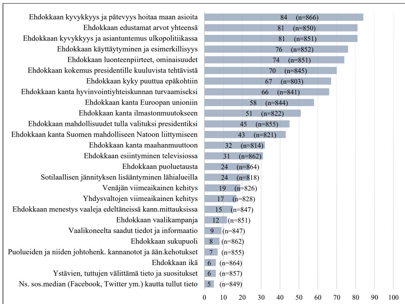
Kuvio 2. Äänestyspäätökseen vaikuttaneet tekijät vuoden 2018 presidentinvaaleissa – niiden osuus, jotka sanoivat asian vaikuttaneen ratkaisevasti tai melko paljon (%).

Lähdeaineisto: Nurmela ym. (2018). Kysymys aineistossa: ”Missä määrin seuraavat tekijät vaikuttivat siihen, ketä äänestit presidentinvaalien ensimmäisellä kierroksella?”. Vaihtoehto ”En osaa sanoa” on koodattu puuttuvaksi tiedoksi.