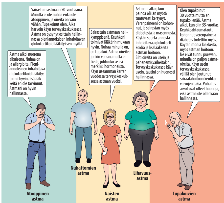
KUVA 3. Aikuisena alkavan astman ilmiä.

tapaan kuin alkavassa keuhkohtaumataudissa. Neutrofiilit voivat myös lisätä limaneritystä ja indusoida musiniigeenien ilmentymistä epiteelin pikarisoluissa (goblet cells) (21). Allergisen astman eläinmallissa tupakansavuallistutus vähensi hyperreaktiivisuutta mutta voimisti viivästynyttä astmareaktiota ja lisäsi neutrofiilista tulehdusta (23).