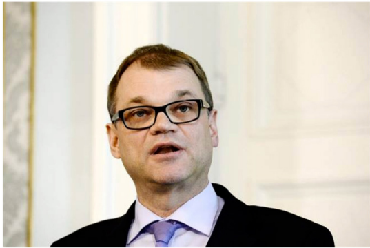
Keskustan puheenjohtaja Juhana Sipilä hallitusohjelmaa, hallituksen kokoonpanoa ja ministerisalkkujen jakoa koskevassa tiedotustilaisuudessa Smolnassa 27. toukokuuta 2015.

Turun Sanomat.