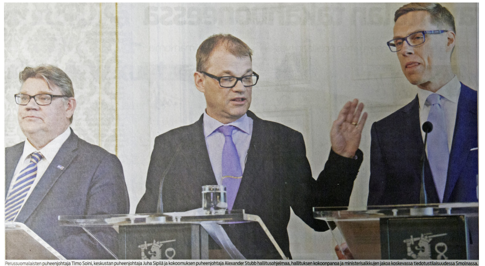
Perussuomalaisten puheenjohtaja Timo Soini, keskustan puheenjohtaja Juha Sipilä ja kokoomuksen puheenjohtaja Alexander Stubb hallitusohjelmaa, hallituksen kokoonpanoa ja ministerisalkkujen jakoa koskevassa tiedotustilaisuudessa Smolnassa.