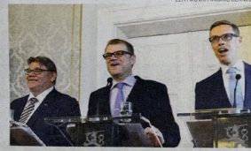
Hallituksen politiikka jakaa yhteiskuntaa hyväosaisiin, sinnitteliin ja syrjäytyviin. Kuvassa ulkoministeri Timo Soini (vas.), pääministeri Juha Sipilä ja valtiovarainministeri Alexander Stubb.

Hyvä hallitus tasoi tasoita sosioekonomisia eroja. Nyt hallitus kiveä tämän tien katteettomilla lupauksilla.