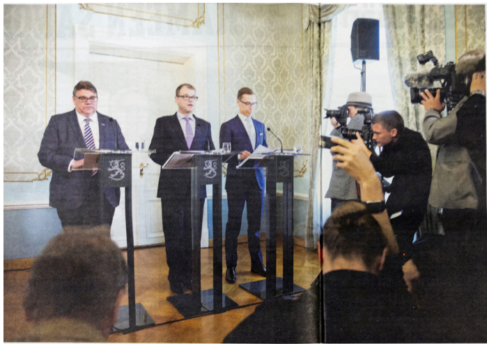
Juha Sipilän johdolla käynnistettiin hallitusohjelma, joka lupaa hyvää yrittäjille ja massasuolen elinkeinoharjoittajille. Monet lausunkädet löivät karvoille lottolassa rupeeritessa aikataulua vain 25 prosentilla.