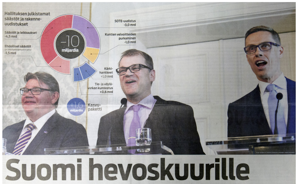
Savon Sanomat.