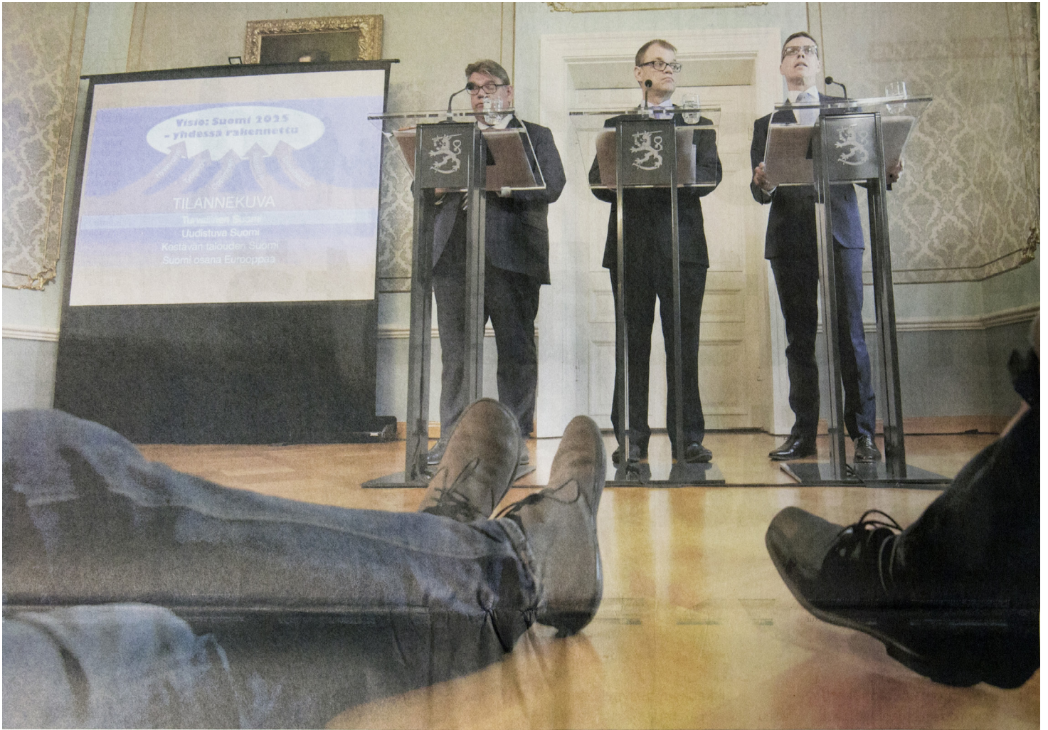
perussuomalaisten puheenjohtaja Timo Soini (vasemmalla), keskustan puheenjohtaja Juha Sipilä ja kokoomuksen puheenjohtaja Alexander Stubb kommentoivat hallitusohjelmaa, hallituksen kokoonpanoa ja ministerisalkkujen jakoa tiedotustilaisuudessa Helsingissä keskiviikkona.