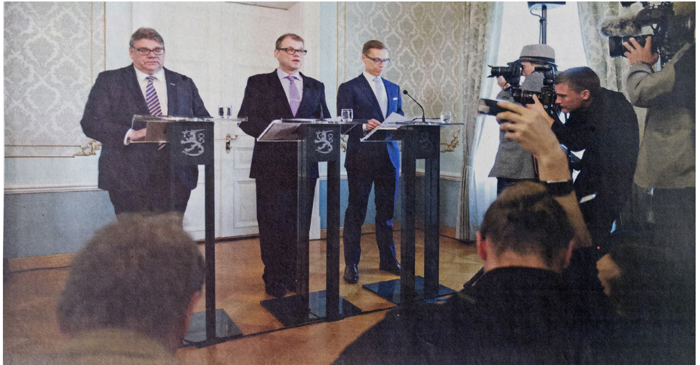
Juha Sipilän johdolla kirjoitettiin hallitusohjelma, joka lupaa hyvää yrittäjille ja maaseudun elinkeinonharjoittajille. Monet kaupunkilaiset kokevat karvaasti esimerkiksi sen, että asuntolainojen korkovähennysoikeus alennetaan verotuksessa nopeutetussa aikataulussa vain 25 prosenttiin.