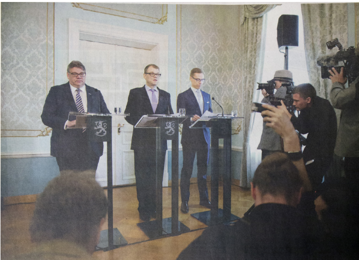
UINA SIPILÄN johdolla käynnistettiin hallitusohjelma, joka lupaa hyvää työttömille ja maaseudun elinkeinonharjoittajille. Monet kaupunkilaiset kokevat karvaasti esimerkiksi sen, että asuntolainojen korkovähennyksessä alennetaan verotuksessa nopeutetussa aikataulussa vain 25 prosenttiin.

Pohjalainen. "Hallitustrio asetti riman korkealle".