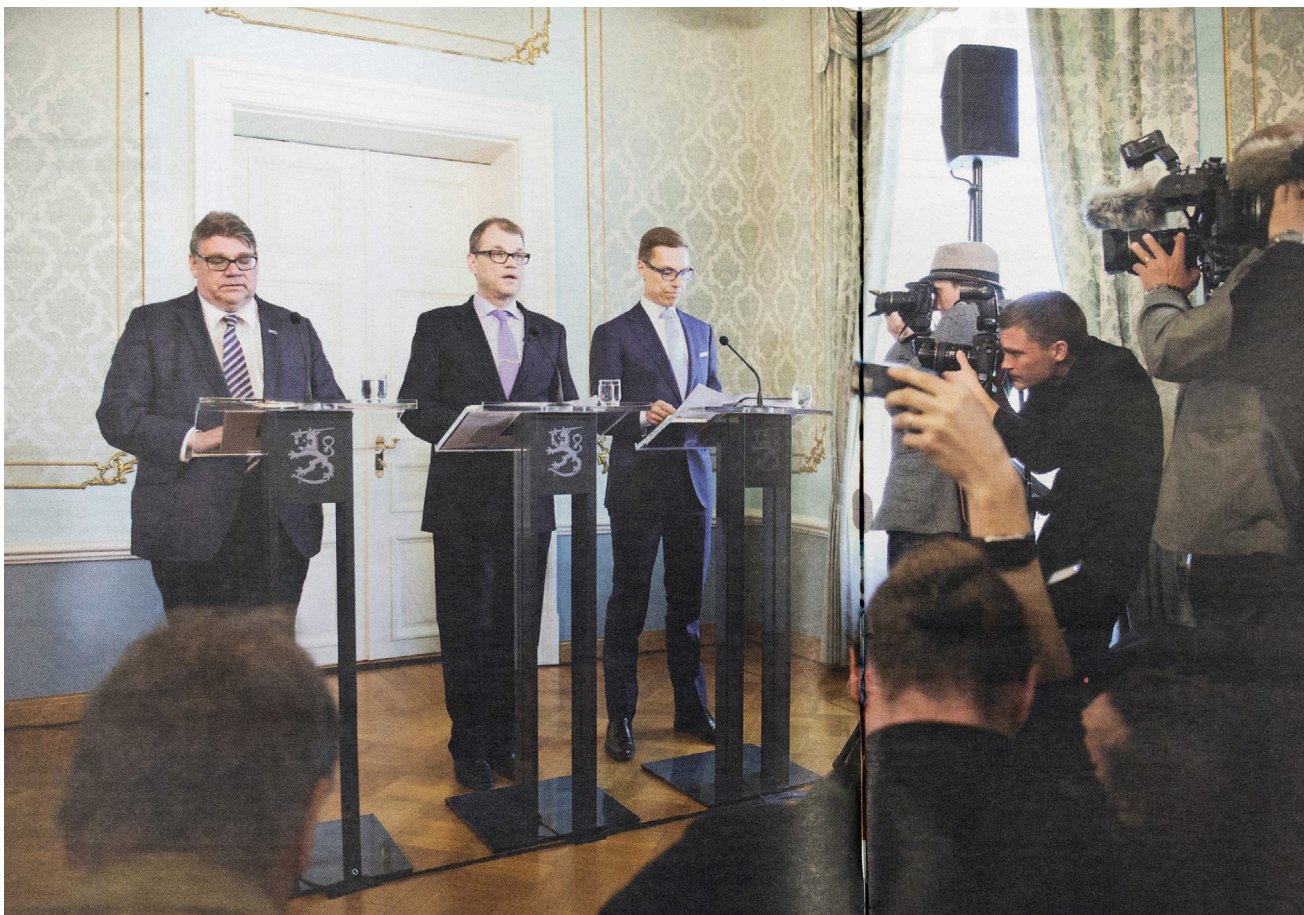
Juha Sipilän johdolla kirjoitettiin hallitusohjelma, joka lupaa hyvää yrittäjille ja maaseudun elinkeinonharjoittajille. Monet kaupunkilaiset kokevat karvaasti siennetään verotuksessa nopeutetussa aikataulussa vain 25 prosenttiin.