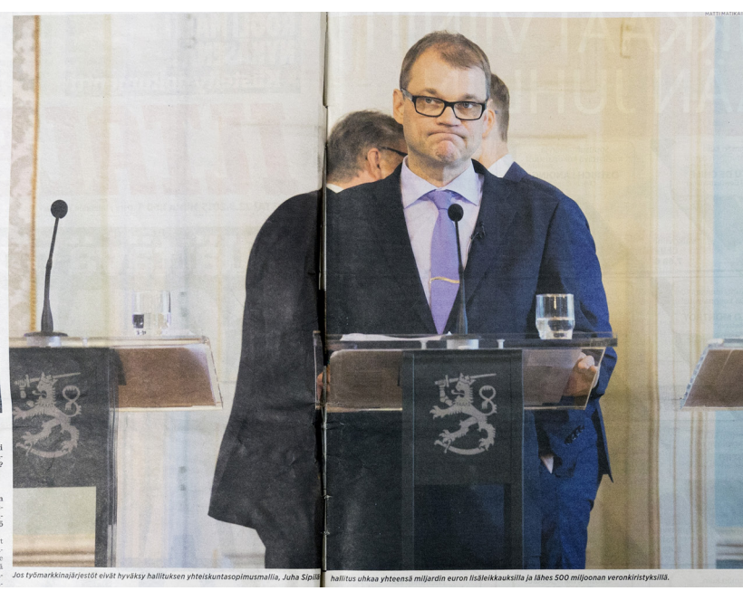
Jos työmarkkinaajrjestöt eivät hyväksy hallituksen yhteiskuntasopimusmallia, Juha Sipilä hallitus uhkaa yhteensä miljardin euron lisäleikkauksilla ja lähes 500 miljoonan veronkiristyksillä.

Onko leikkais sen viisi prosenttia, mikä tuottavuusköna tavotteita on? – Se voisi olla esimerkiksi. Petetty lupaus Keskusta lupasi ennen vaaleja, että koulutukseen ei leikata. Nyt kuitenkin leikataan. Petettykö lupauksenne? – Koulutuksessa on nyt määrittämässä lyhyttä tase-päätös on, että silinä joudutaan joiain leikkamaan, mutta muuten ei ta-