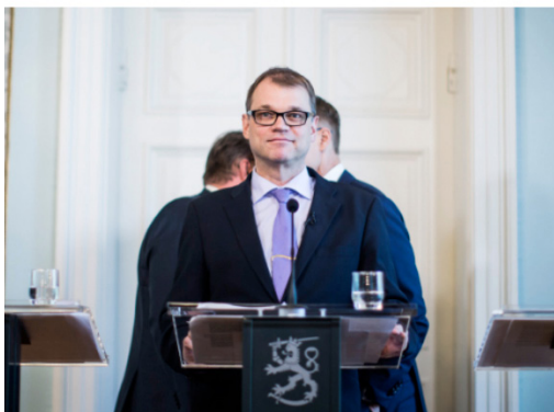
Timo Soini, Juha Sipilä ja Alexander Stubb hallitusohjelman tiedotustilaisuus Smolnassa 27.5.2015.