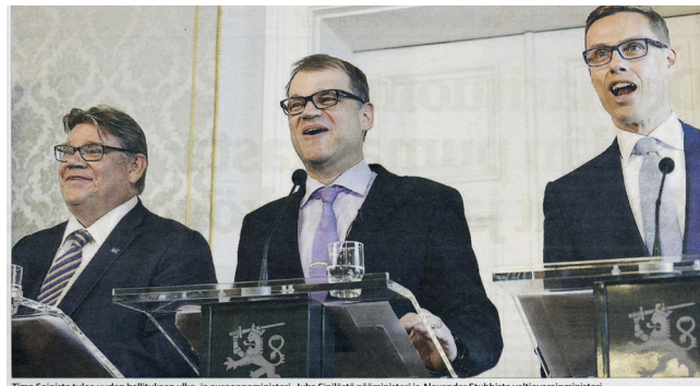
Timo Soinista tulee uuden hallituksen ulko- ja eurooppaministeri, Juhana Sipilästä pääministeri ja Alexander Stubbista valtiovarainministeri.

■ Kipeistä päätöksistä osa on ehdollisia Nauravan kolmikön myrskyvaroitus!