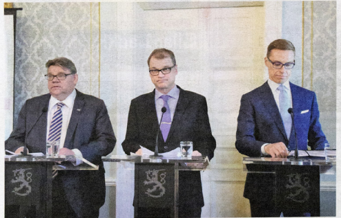
Puolueidensa puheenjohtajat Timo Soini (ps.), Juha Sipilä (kesk.) ja Alexander Stubb (kok.) kertoivat maan seuraavan hallituksen ohjelmasta keskeiviköna Helsingissä.

kaan päätöksiä ja vie asiat loppuun asti. Lupaus viittaa suoraan edellisen hallituksen helmasyrtin: päätöksiä lähinnä siirrettiin hamaan tulevaisuuteen ja vain muutamaa niistä vietiin loppuun. Yhdestä lupauksestaan tuleva pääministerikin jo lipesi. Hallitusohjelma ei ole alun perin kaavailtuun tapaan suppea, noin 15 sivun strategiapaperi, vaan huomattavasti laajempi. Myöskään ministeriiden määrää ei karsita aivan niin paljon kuin piti, mutta sittenkin reilun puoleisesti. Edellisen hallituksen aloittaessa ministereitä oli peräti 19, kun uuden hallituksen vahvuus on 14.