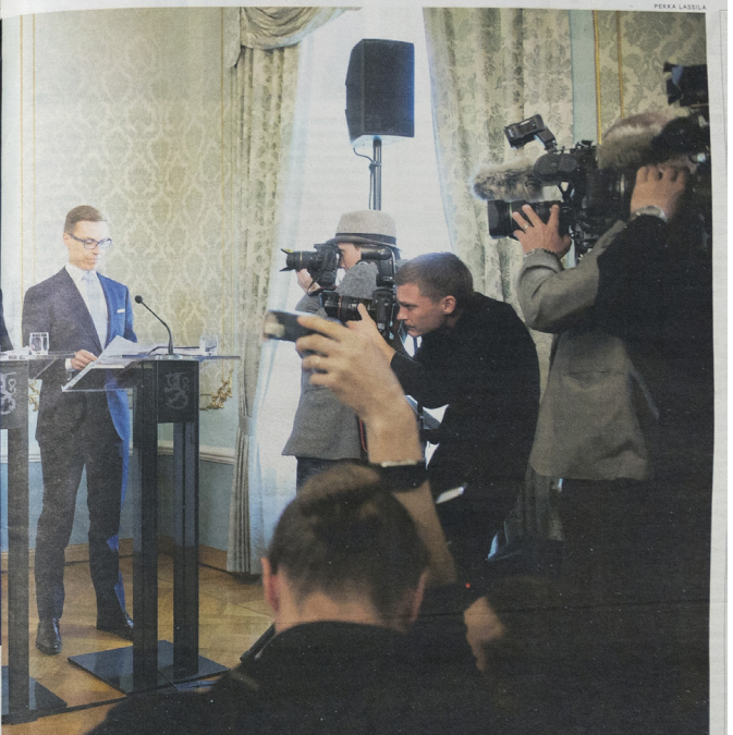
Monet kaupunkilaiset kokevat karvaasti esimerkiksi sen, että asuntolainojen korkovähennysoikeus alennetaan verotuksessa nopeutetussa aikataulussa.