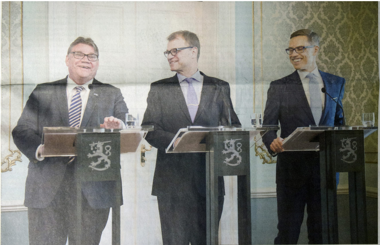
Tulevat ministerit Timo Soini, Juha Sipilä ja Alexander Stubb esittelivät kolmen puolueen hallitusohjelman Smolnassa.