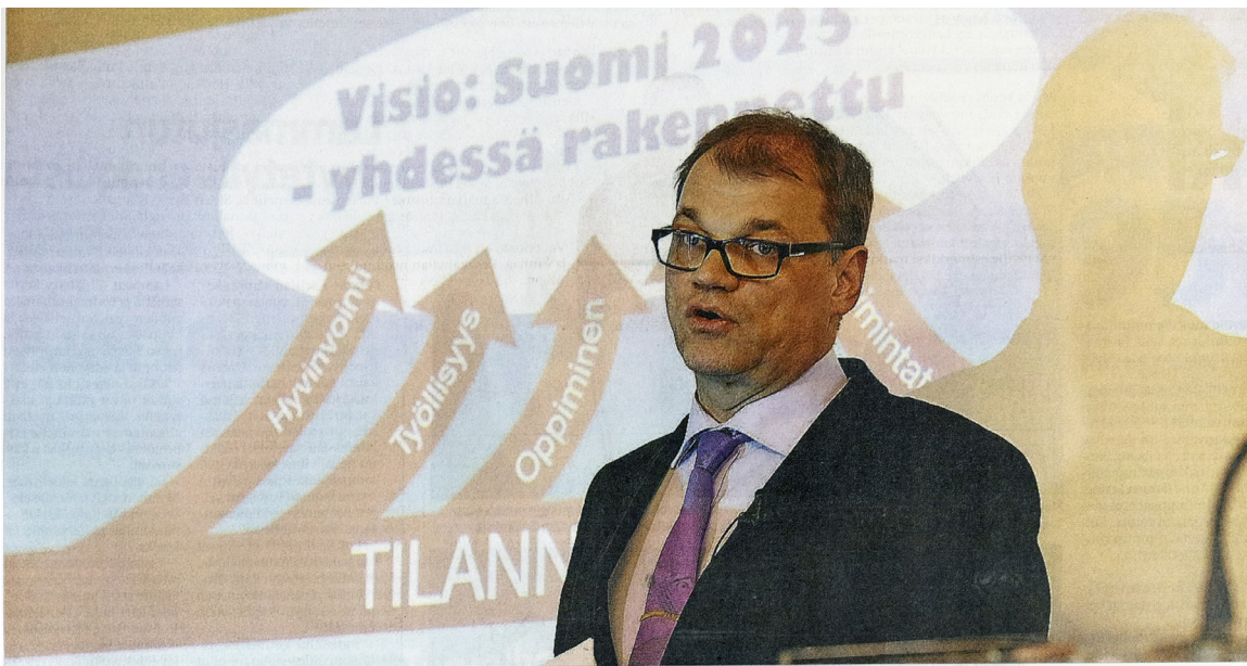
Juha Sipilä esitteli tulevan hallituksen vision siitä, miten Suomen talous saadaan nousuun. Kipeät päätökset koskettavat kaikkia suomalaisia, hän korosti.