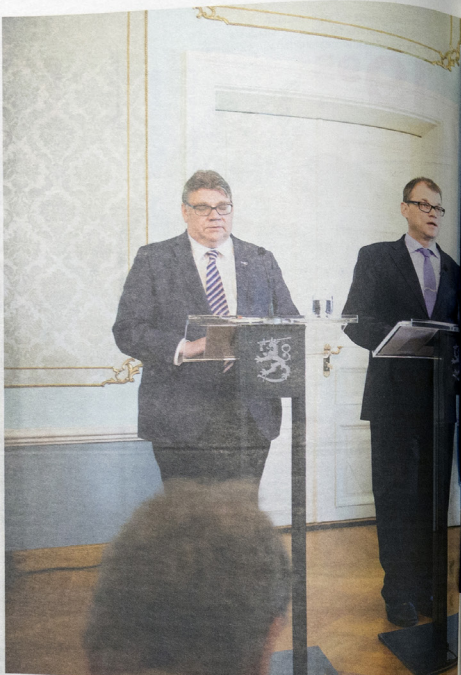
JUHANA SIPILÄN johdolla kirjoitettiin hallitusohjelma, joka lupaa hyvää yrittäjille ja maaseudun elinkeinoelämälle vain 25 prosentilla.