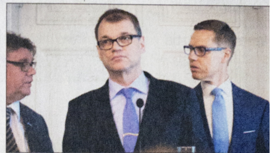
Hallituksen keskeiset ministerit ovat ulkoministeri Timo Soini (vas.), pääministeri Juha Sipilä ja valtiovarainministeri Alexander Stubb.

Vaikka hallitusohjelmasta haluttiin tehdä