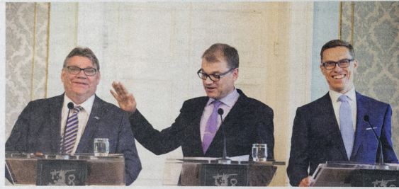
Tutkija ei usko yhdenkään eduskuntaryhmän aktiivisesti varautuvan hajoamiseen pykälämuutoksesta huolimatta.

- Lähtötilanne oli siis se, että jos eduskuntaryhmä hajooa kesken vaalikauden, niin puolueet lasketaan uuden tilanteen mukaan.