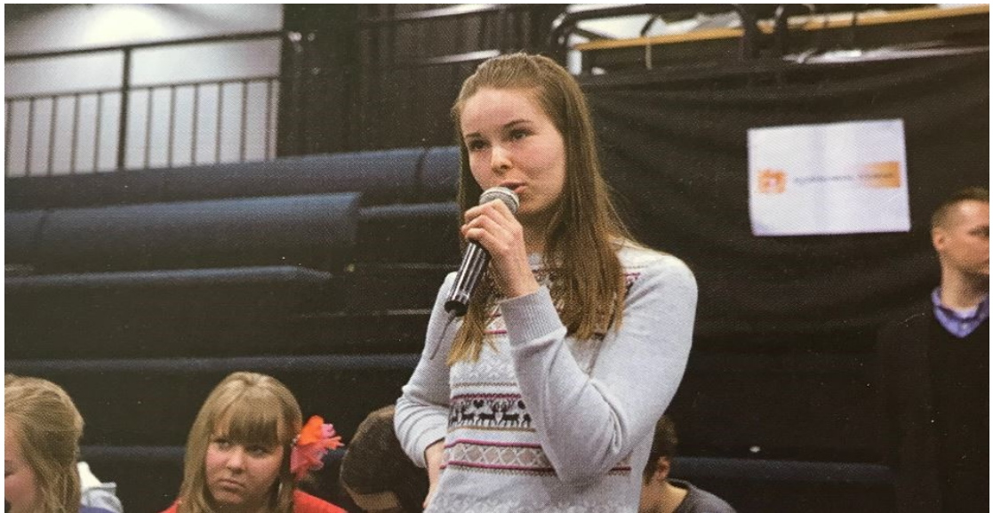
Esimerkkikuva 5. Aineiston kuva 25/12 "Tyttö äänessä" Nuorisotyö 1/12, s. 23

2003 lehdissä oli nähtävissä suuntaus nuorten aktiivisen kansalaisuuden ja vaikuttamismahdollisuuksien lisääntymiseen, mutta vuoden 2012 se näkyy entistä selvemmin. Kuvissa on tyttöjä puhumassa mikrofoniin, osallistumassa tapahtumiin ja joissa he käyttävät puheenvuoroja. Entistä vähemmän tytöt harrastavat tai ovat nuorisotyön perinteisessä toiminnassa mukana. Aiemmassa tutkitussa vuosikerrassa tytöt olivat vaikuttamisen äärellä ja liepeillä, mutta vuoden 2012 tytöt olivat selvästi enemmän äänessä kuin pelkästään kuulemassa aikuisia. Oletan, että tyttöjen puheenvuoroja on kuulemassa toisten tyttöjen ja nuorten lisäksi myös aikuisia, joita tyttöjen ajatukset ja mielipiteet kiinnostavat. Tämä osoittaa esimerkiksi myös nuorisolaissa määrätyn kuulemisvelvollisuuden toteutuvan ainakin joissakin asioissa. Vaikka virallisista nuorten kuulemistilanteista ei kuvissa varmaankaan ole kysymys, on tärkeää osoittaa, että myös