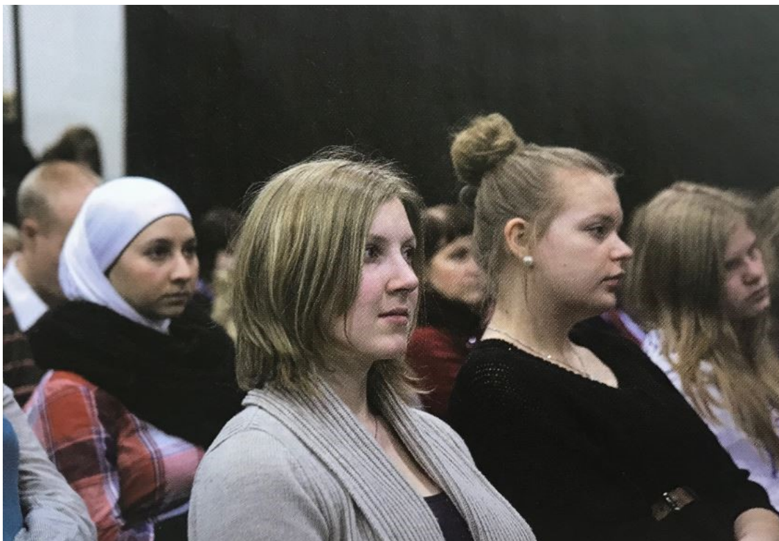
Esimerkkikuva 9. Aineiston kuva 18/12. ”Huivityttö taustalla” Nuorisotyö 1/12, s. 24

Osallisuus kietoutuu myös intersektionaalisuuteen etnisen taustan muodossa. Myös muun kulttuuriset tytöt voivat toimia samoissa vaikuttamisen paikoissa kuin perinteisemmän suomalaisen tyttöyden edustajat. Tätä on merkittävää tuoda esille, sillä vaikuttaminen on kaikkien nuorten, sekä tyttöjen ja poikien oikeus. Esimerkkikuvassa X näkyy yleisön joukossa huivipäinen tyttö ja oletan kuvan olevan valittu juuri moninaisuuden näkökulmasta. Kuva viestii ”erilaisuuden normaaliudesta”. Lehdessä halutaan näyttää tyttöyden moninaisuutta myös tästä näkökulmasta.