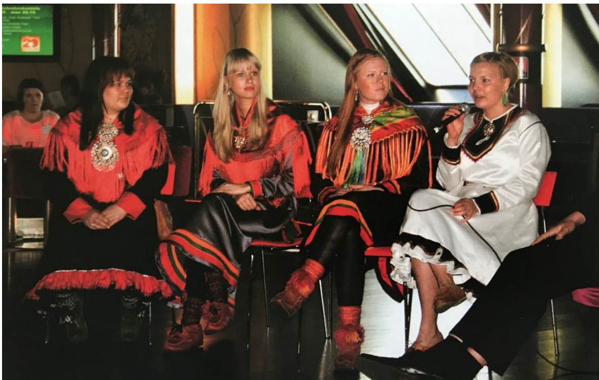
Esimerkkikuva 8. Aineiston kuva 39/12. ”Saamelaistytöt”. Nuorisotyö 4/12, s. 20

viestejä ja merkityksiä. Tytöt istuvat rivissä omilla tuoleillaan ja yhdellä tytöistä on mikrofoni, johon hän puhuu.