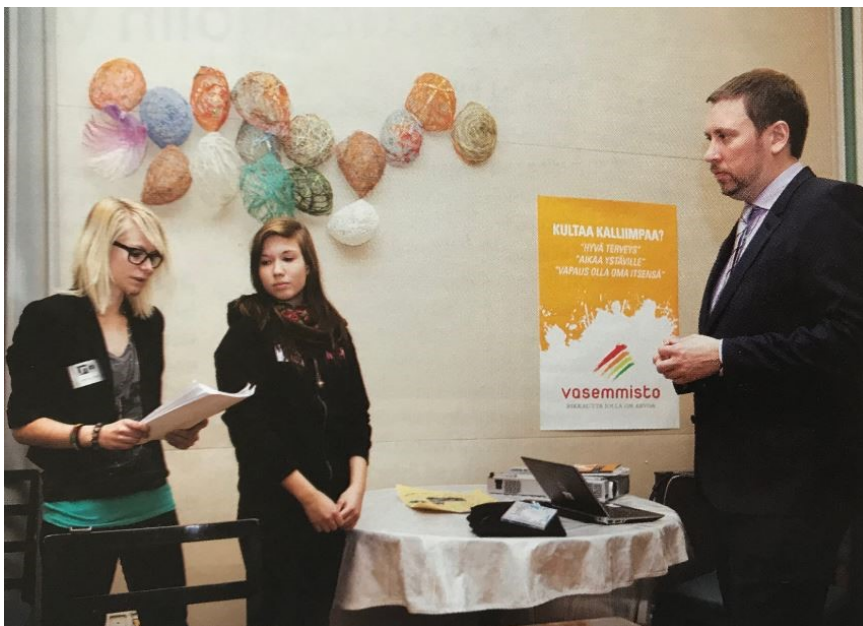
Esimerkkikuva 10. Aineiston kuva 12/12. "Tytöt ja ministeri" Nuorisotyö 8/12, s.8

välittämää asiaa kuunnellaan. Tytöt hyödyntävät oikeuttaan vaikuttaa ja ministeri vahvistaa oikeutta asianmukaisella toiminnallaan.