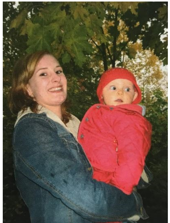
Esimekkikuva 3. Aineiston kuva 12/03 "Tyttö ja lapsi". Nuorisotyö 7/2003, s. 20

Tutkimusaineistossa vuonna 2003 on kaksi huomiota herättävää kuvaa työstä ja vauvasta. Ensimmäisessä kuvassa lapsi on vaunuissa ja tyttö on kumartunut vaunujen ylle kameraan katsoen. Kuva on selvästi lavastettu, jotta kuvaaja saa otettua lähikuvan sekä vaunuissa istuvasta lapsesta että vaunujen ylle kumartuneesta työstä. Lavastus ei kuitenkaan tee kuvaa täysin keinotekoiseksi, sillä tyttö ja lapsi vaikuttavat tuntevan toisensa ja olevan samaa seuruetta. Molemmat kuvattavat katsovat kameraan, vauvalla on tutti suussa ja tyttö on arvoituksellisen näköinen katsoessaan kameraan sivusilmällä. Esimerkkikuvassa tyttö seisoo vauva sylissä katsoen kameraan hymyillen. Vauva katsoo muualle. Nuoruuden vapautteen ja keskeneräisyyteen liittyvän näkökulman mukaan kuvan tyttö ei ole vauvan äiti, vaan isosisko tai lastenhoitaja. Kuvaustilanne ei vaikuta olevan hoivaamiseen liittyvää, sillä sekä tyttö että lapsi ovat hieman taakse päin kallistuneena, etäisyyttä ottamassa. Hoivaaminen ja pikkusisarten hoitaminen nähdään usein tytöille luonnollisena taitona ja ehkä myös jopa kiinnostuksenkohteena.