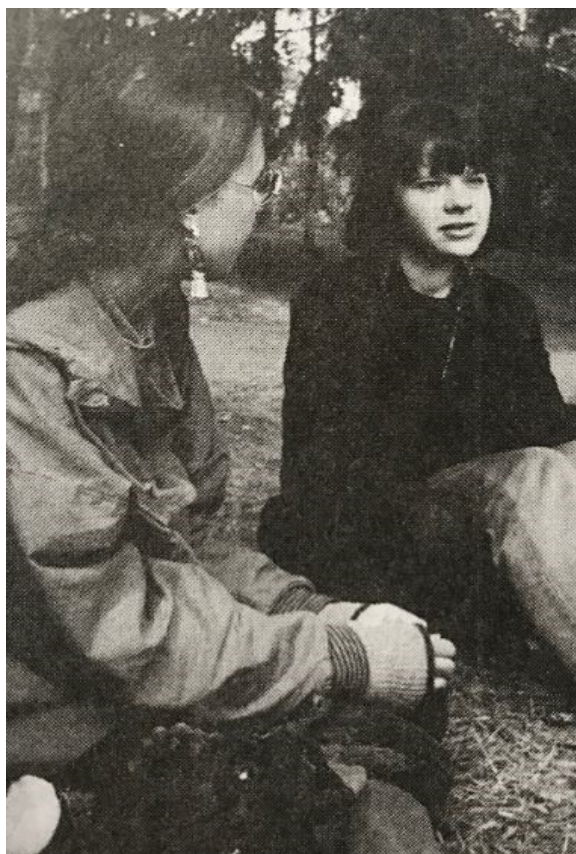
Esimerkkikuva 1. Aineiston kuva 11/93 "Hengailua" Nuorisotyö 7-8/1993, s. 21

Vuoden 1993 kuvissa korostuu eräänlaiset hengailukuviksi nimeämäni kuvat, joissa tytöt vain ovat tai toiminta näyttäyty oleilemisena. Näissä kuvissa ei tehdä mitään erityistä eikä ympäristö anna vihjettä, mitä kyseisessä ympäristössä saatettaisiin yleensä tehdä. Kuvien tytöt eivät toimi, mutta he eivät myöskään näytä erityisen passiivisiltakaan. Kuvien tytöt ylläpitävät monimuotoisia ystävyysuhteita, ottavat askeleita itsenäistymisen suuntaan ja mahdollisesti pyrkivät välttämään yksinäisyyttä (Aapola 1992, 91-99). Kuvista ei näy, missä yhteydessä kuvat on otettu. Vaikuttaa siltä, että hengailukuvat on otettu tyttöjen vapaa-ajanympäristöissä, joissa he kodin ulkopuolella toimivat. Kuvissa istuskellaan tai seisuskellaan.