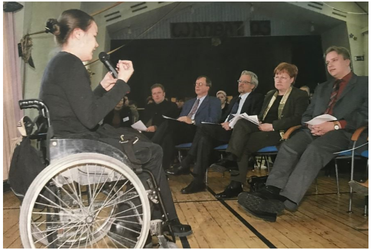
Esimerkkikuva 7. Aineiston kuva 14/03 ”Tyttö ja poliitikot” Nuorisotyö 2/2003, sivu 9

Kuvassa etualalla alaviistosta kuvattuna on tyttö pyörätuolissa, mikrofoni kädessä. Tyttö on rivissä istuvien aikuisten edessä ja puhuu heille mikrofonin kautta. Mikrofoni takaa, että tytön ääni kuuluu kaikille kuulijoille. Tarkemmin kuvaa katsoessa voi nähdä, että tyttö ei puhu ainoastaan selvästi kuvan oikeassa reunassa näkyville muutamalle aikuiselle, vaan