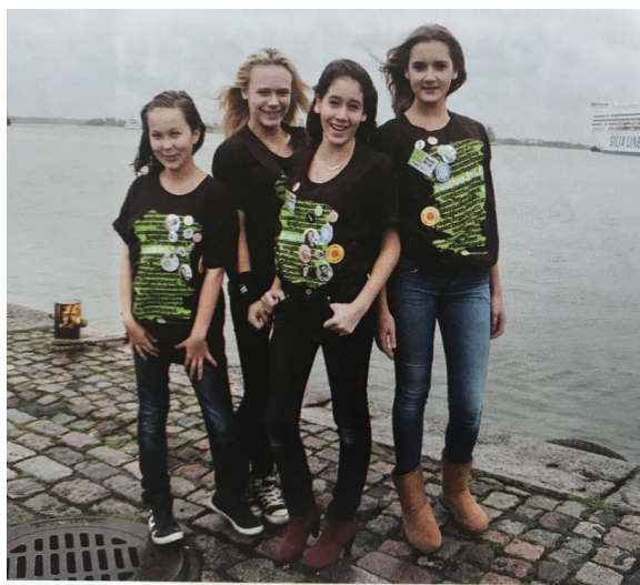
Esimerkkikuva 14. Aineiston kuva 7/12 "Tytön rannalla" Nuorisotyö7/12, s. 8

Esimerkkikuvassa 14 näkyy tyttöjen rennompi tapa olla kuvattavana. Rannalla olevassa kuvassa on paljon liikettä, vaikka tytöt seisovat paikallaan: tuuli heiluttaa hiuksia, taustalla lipuu laiva ja etualalla oleva tyttö näyttää olevan vain hetkellisessä pysähdyksessä. Hänen asentonsa on ehkä jopa hieman maskuliininen. Mukavan tyttöyden kuvaa kuitenkin ylläpitää ystävälliset kasvot ja mukavat ilmeet.