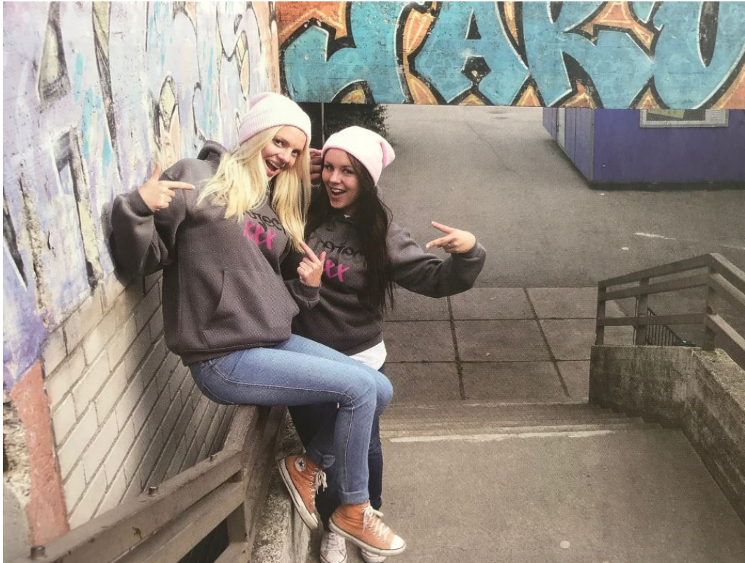
Kuvaesimerkki 15 Aineiston kuva 2/12. "Tytöt portailla" Nuorisotyö 5-6/12, s. 7

Esimerkkikuvassa 15 olevat tytöt ovat vähän edellisen kuvan tyttöjä isompi ja poseerauskin on erilainen. Tyttöjen vaatetus on muodikas ja poseerauskin ehkä muotiin ja aikaan sopivia.