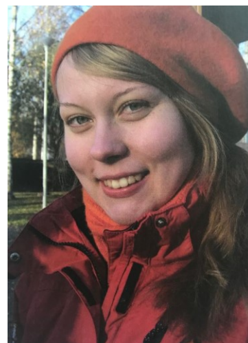
Esimerkkikuva 11. Aineiston kuva 30/12 ”Hymyilevä tyttö 2” Nuorisotyö 2/12, s. 11

Vaikka kuvat ovat poseerausta, jopa kevyttä passikuvaustyyppistä hetken taltiointia, niihin sisältyy paljon sukupuoleen liittyvää informaatiota, liikettä ja liikkeen tuntua. Näissä kuvissa ei ole arvioitavana suhdetta muihin kuvassa olijoihin vaan kaikki informaatio on yhdessä henkilössä. Hymy, ystävällinen katse. Onko kyse tytön omasta valinnasta vai onko kuvaaja halunnut lehden sivuille ystävällisestä vaikuttavan tytön? Onko kohde itse päättänyt olla kuvassa aseistariisuvan näköinen vai onko aikuinen kuvaaja ajatellut, että ystävällisen ja kiltin näköinen kuva on katsojan kannalta parempi? Ehkä kuvaaja ajattelee tytön roolia ja mainetta, johon ei ehkä räväkämpi poseeraus ”sovi”. Hurjailmeiset kuvat usein liittyivätkin jonkinlaiseen esitykseen tai näyttölemiseen. Aktiivinen tyttö on kiltti ja ystävällinen?