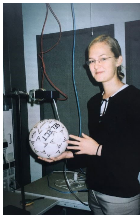
Esimerkkikuva 4. Aineiston kuva 31/03 ”Taitava tyttö” Nuorisotyö 6/2003, s. 12

Joskus kuvan viestin vahvistamiseksi on tehtävä pieniä temppuja. Siitä hyvänä esimerkkinä toimii vuoden 2003 lehdessä ollut kuva, jossa tyttö seisoo jalkapallo kädessä ja hymyillen katsoo kameraan. Vaatetus ei ole palloillun sopiva, vaan lähinnä siisteihin sisätöihin. Valokuvan ympäristö näyttää olevan jonkinlainen kemian- tai fysiikanluokka. Kuva pyrkii kertomaan riittävästi informaatiota ja se vaikuttaa jopa hölmön alleviivaavalta, mutta se tekee kuvasta vaikuttavan. Kuvaa katsoessa voi heti päätellä, että kuvan työltä onnistuu sekä urheilu että kemia, molemmat poikien osaamis- ja vahvuusalueisiin laskettuja taitoja. Kuvaaja antaa valmiit tulkintavälineet kuvan katsojalle, jottei virhetulkintojen mahdollisuutta ole.