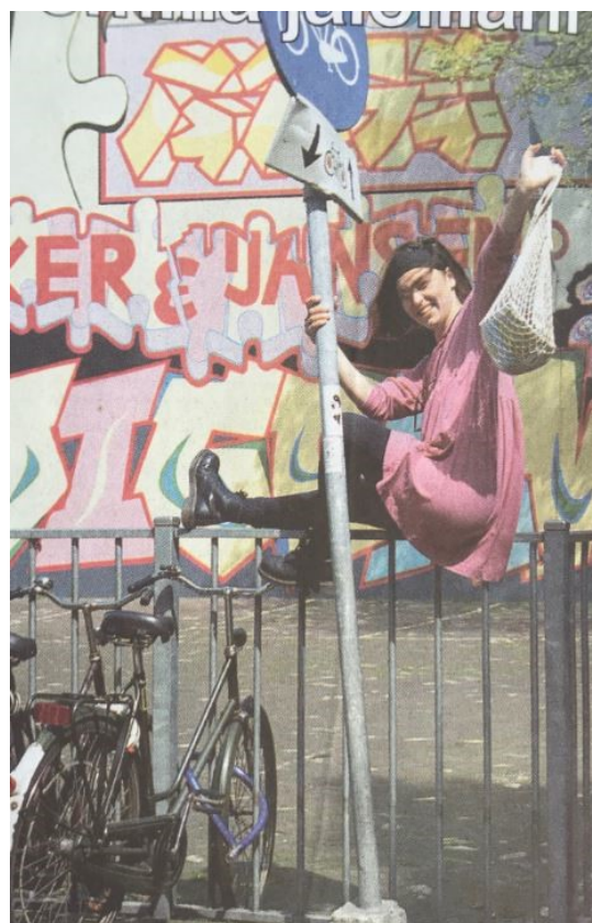
Esimerkkikuva 13. Aineiston kuva 38/93 "Tyttö tolpassa" Nuorisotyö 5-6/1993, s. 8

Vuoden 1993 lehdissä poseerauskuvat ovat eri tyyppisiä kuin uudemmissa lehdissä. Kuvat ovat selvästi toiminnallisempia kuin myöhemmissä lehdissä eli tytöt poseeraavat tehden jotain samanaikaisesti (esimerkkikuva 13). Poseerauskuvien määrä oli huomattavasti korkeampi vuoden 2012 kuin vuoden 2003 lehdissä. Useista yksittäiskuvista voi päätellä, että useiden kirjoituksen aiheina ainakin jossain määrin on kuvassa oleva tyttö. Kuvat eivät vaikuttaneet irrallisilta kuvituskuville vaan tekstin yhteyteen otetuilta kuville. Osa poseerauskuvista on perinteisiä asiallisia hymyilykuvia, mutta varsinkin kahden tai useamman tytön poseerauskuvissa asento ja ilmeet olivat vapaampia ja ehkä norveja rikkovia.