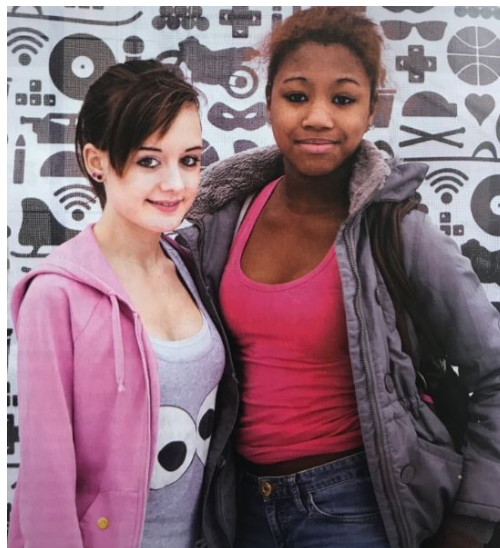
Esimerkkikuva 6. Aineiston kuva 20/12 "Kaksi tyttöä" Nuoristyö 2/12, s. 6

Maahanmuutto ja monikulttuuristuminen eivät ole ainoat perinteisen tyttökuvaan rikkoja vaan myös saamelaisien näkyminen kyseisen vuoden lehdessä on merkille pantavaa. Kyse ei ole suuresta määrästä kuvia, mutta lehdistä ja tekstiyhteyksistä irrotettuja kuvia tarkastellessa saamelaisasuihin pukeutuneiden tyttöjen määrä on silmiinpistävä. Erittelen tarkempia havaintoja etnisyydestä ja vammaisuudesta suhteessa tyttöyteen alaluvussa 4.1.