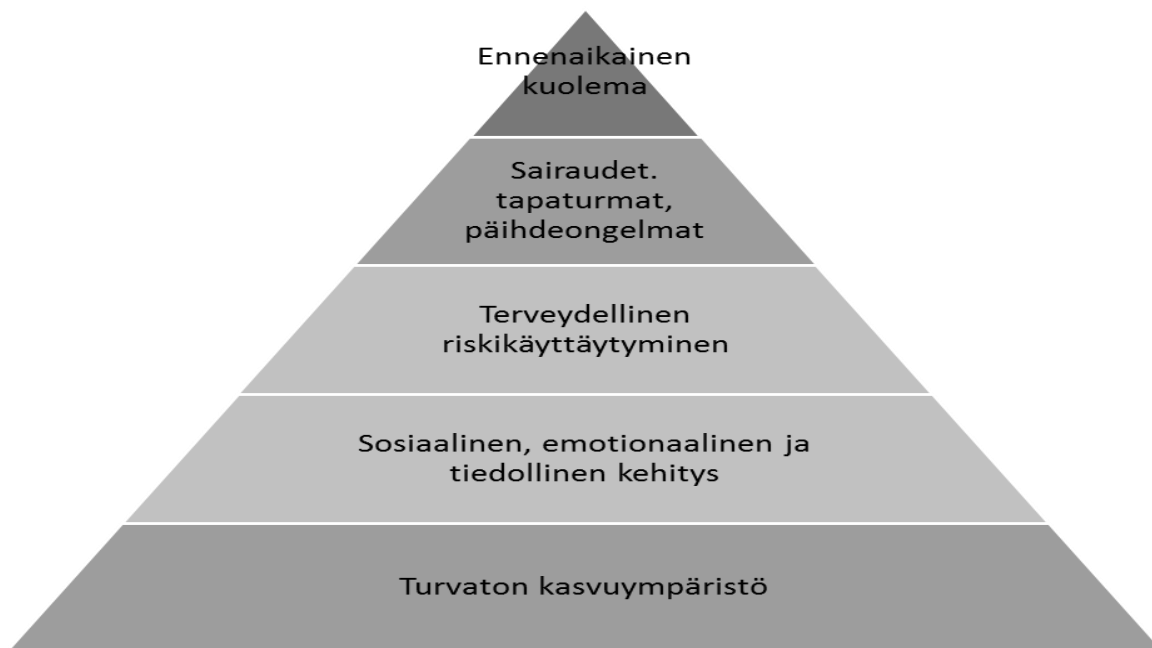
Kuvio 1. Turvattoman kasvu ympäristön seuraukset (Sosiaali- ja terveysministeriö, Selvityksiä 2007:27, 52.)

Husson (2003,17) mukaan alttius parisuhdeväkivallalle näyttää siirtyvän sukupolvelta toiselle ja tämän vuoksi myös vanhempien käyttäytymismallilla on merkitystä parisuhdeväkivallan suhteen. Sosiaali- ja terveysministeriön lähisuhdeväkivaltaan ja alkoholiin liittyvässä selvityksessä (2007, 52) todetaan turvattoman kasvu ympäristön lisäävän sekä häiriökäyttäytymisen että epäsosiaalisen käyttäytymisen riskiä. Turvattoman kasvu ympäristön syynä nähdään yleensä olevan turvallisen vanhemmuuden puuttuminen, joka vaarantaa lapsen kehityksen. Lapsuuden aikana koetut ja opitut väkivaltaiset toimintamallit voivat seurata yksilöä aikuisuuteen ja sen myötä omaan parisuhteeseen ja siten koko perheeseen. Pahimmillaan seurauksena on ylisukupolvinen turvattomuuden ja heikentyneen hyvinvoinnin ketju (kuvio 1.).