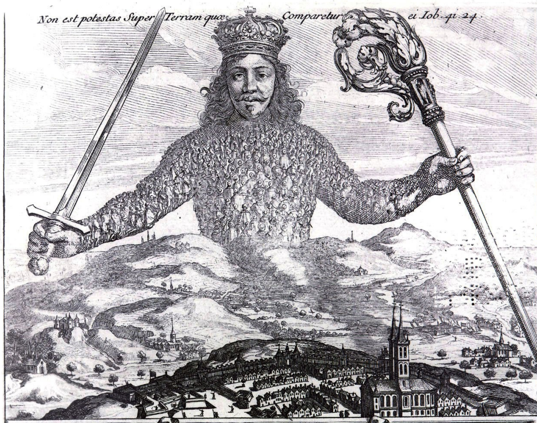
Kuva 1, Leviathan, 1651.