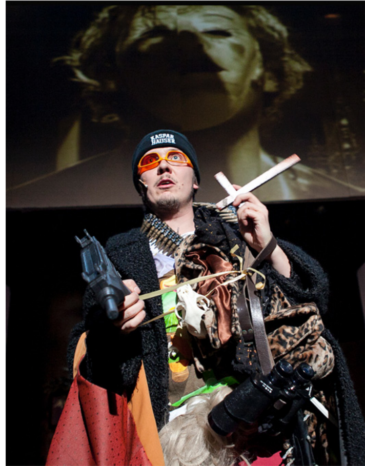
Q-teatteri, Kaspar Hauser