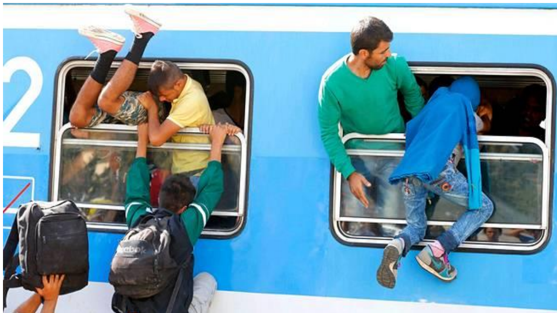
Kuva 10: Helsingin Sanomat, 19.9.2015.

Kuva 9: Helsingin Sanomat , 21.7.2015. Kuva: Ognen Teofilovski/REUTERS .