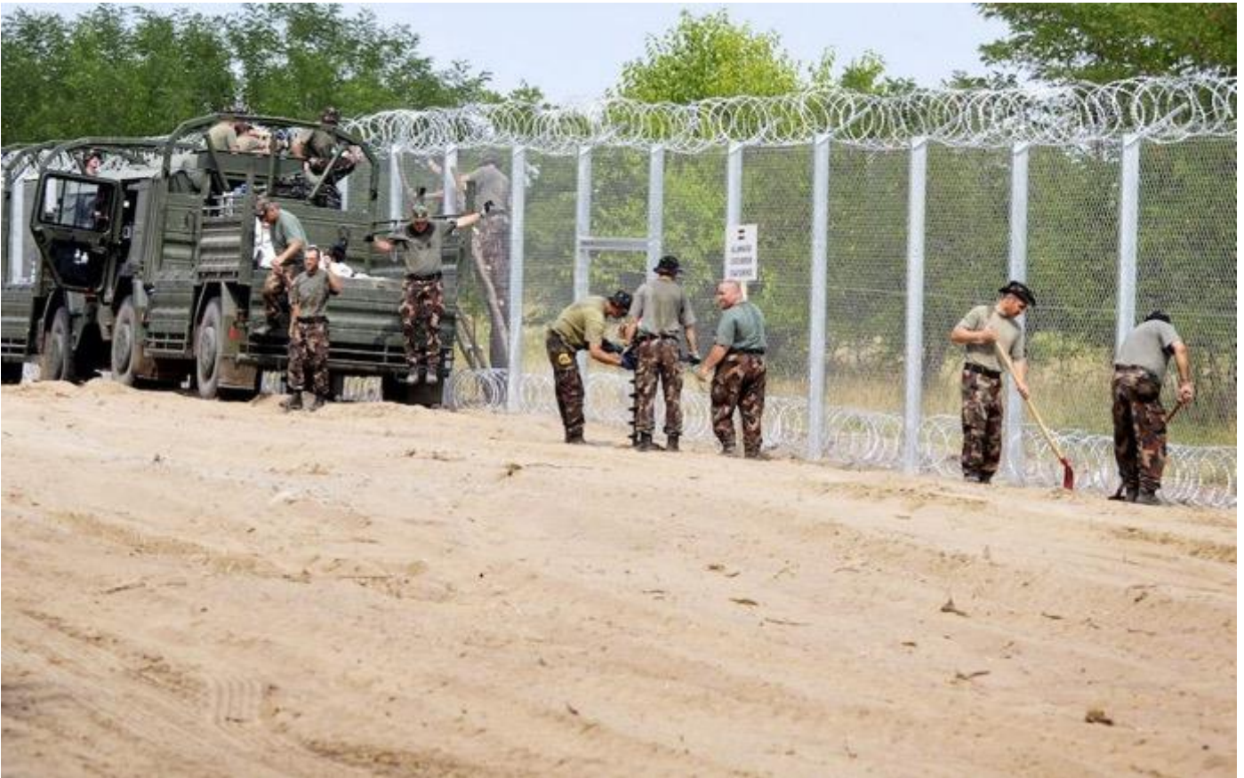
Kuva 24: Dagens Nyheter, 25.07.2015.

Piikkilanka-aitaa kuvaavissa kuvissa voi olla muitakin kuin turvapaikanhakijoita. Dagens Nyheterin kuvassa, jossa univormuihin pukeutuneet miehet rakentavat aitaa (DN, kuva 24), on hyvin konkreettinen ”rajat kiinni” -kuva. Kuvassa rakennetaan konkreettisesti aitaa, jonka tarkoituksena on estää turvapaikanhakijoiden ja pakolaisten laiton maahan pääsy. Kuvan värit on ruskea, näyttäisi kuin aitaa rakennettaisiin keskelle autiomaata. Otos kertoo ennen kaikkea humanitarismin kehystämisestä- ei niinkään turvapaikanhakijoiden ja pakolaisten representoinnista vaan ilmiöstä ylipäätään. Vaikka kuvassa ei ole turvapaikanhakijoita tai pakolaisia, on viesti toiseuden näkökannasta hyvin selkeä: järjestystä vaalivat, byrokratiaa kunnioittavat rakentavat aitaa, jotta jotain päinvastaista ei pääsisi aidatun alueen sisäpuolelle. Näin ollen humanitarismirepresentaatio vahvistuu järjestyksen ja yhteiskunnan lakien kunnioittamisen osalta ja toisaalta hajottaa käsitystä edistyksestä ja monikulttuurisuuden kunnioittamisesta.