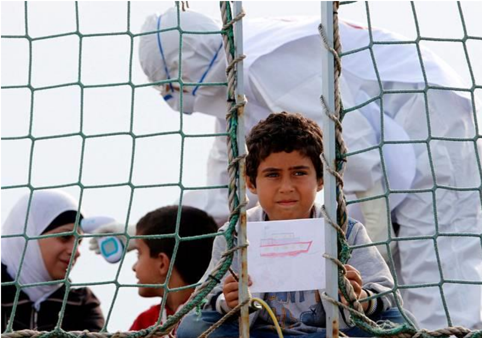
Kuva 3: Helsingin Sanomat, 17.6.2015.

lapsen kanssa samaa kieltä. Valokuvan punctum 18 onkin piirustus, joka symboloi lapsen viattomuutta. Humanitarismi hahmottuu leikkimistä ja opettamista kuvaavissa kuvissa lasten oikeuksia puolustavaksi, mutta myös byrokraattiseksi ja sääntöjä korostavaksi.