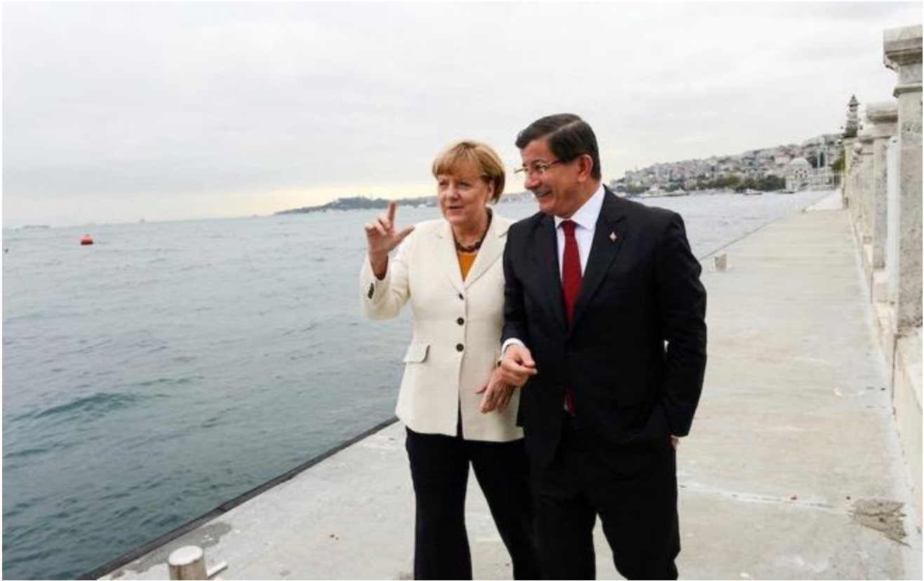
Kuva 13. Dagens Nyheter, 19.10.2017.