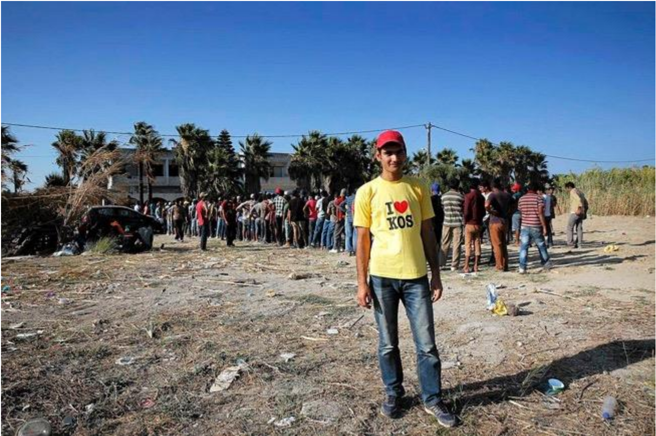
Kuva 12: Helsingin Sanomat , 7.8.2015.

Humanitarismin hahmottamisen näkökulmasta kuva vahvistaa ajatusta siitä, että turvapaikanhakijoita ja pakolaisia ”on ohjeistettava” normeihin. Turistipaitoja ja turistipaitojen taustalla olevaa sosioekonomista normia ei muuten voi ymmärtää. Se on siis jossain määrin kulttuuri relativistista. Humanitarismikäsitys koulutuksen ja sivistyksen ihanteesta erottuu. Se myös rikkoo myyttiä lomaparatiisista, turvapaikanhakijat ja pakolaiset ikään kuin tuovat konfliktin maailmaan, jonne suomalaiset ja ruotsalaiset tulevat nauttimaan lämmöstä ja auringosta. Massakuvien humanitaarinen myytti on niin Dagens Nyheterissä kuin Helsingin Sanomissa melko yhtenäinen. Kuten yllä on analysoitu, kuvat konnotoivat kasvottomuutta ja vahvistavat käsitystä kollektivismista yksilöllisyyden sijaan.