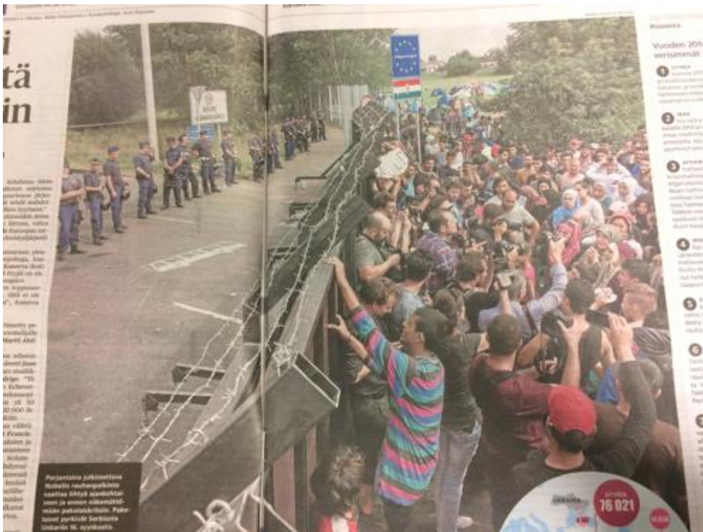
Kuva 23