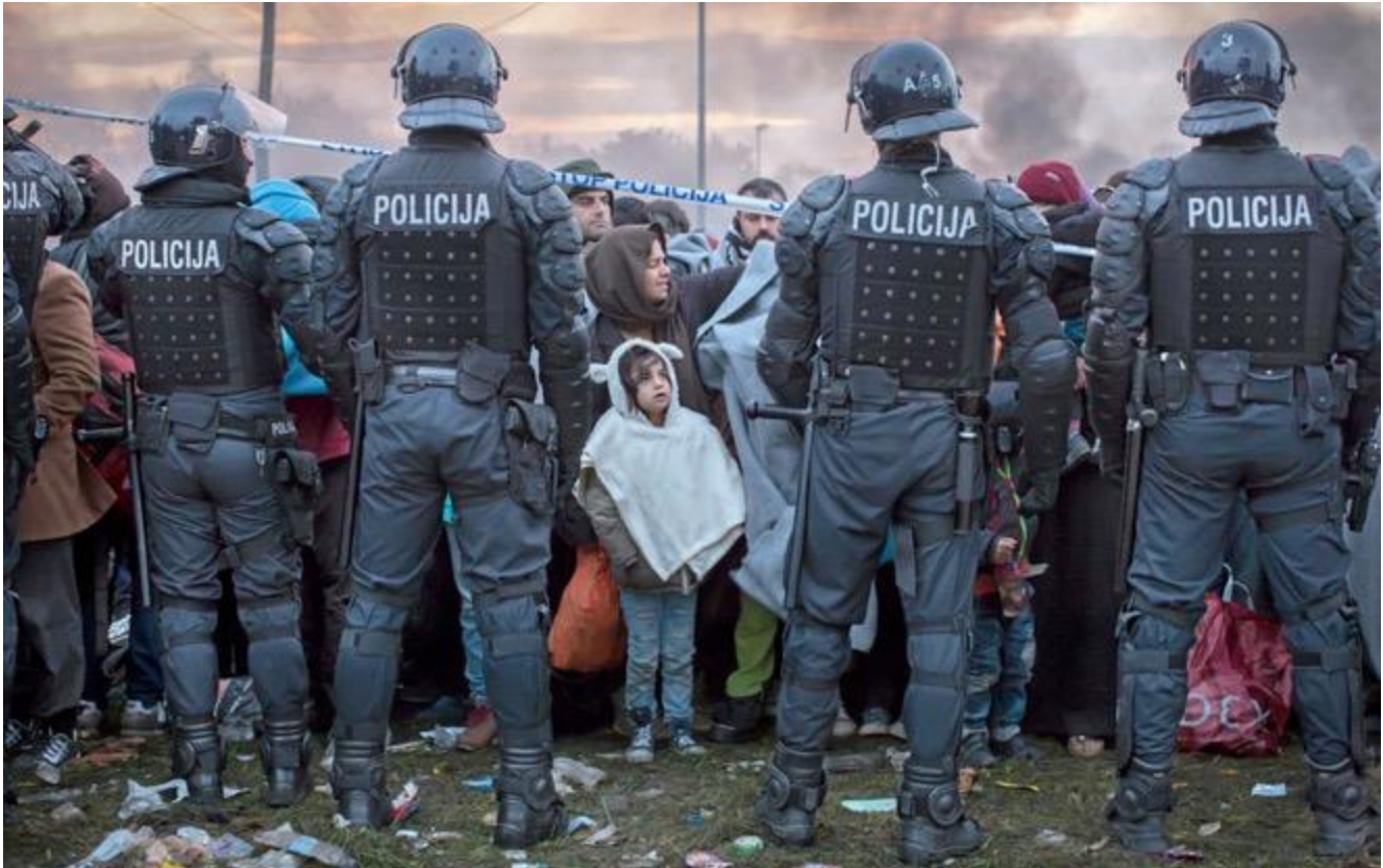
Kuva 22: Dagens Nyheter, 25.10.2015.

kuvia poliiseista, joiden kasvot ovat nähtävissä, on molemmissa lehdissä miltei saman verran. Kaiken kaikkiaan poliiseja on kuvattu Dagens Nyheterissä Helsingin Sanomia enemmän. Tämä on yllättävää siksi, että se rikkoo ruotsalaista myyttiä monikulttuurisuudesta, liberaalisuudesta ja väkivallattomuudesta.