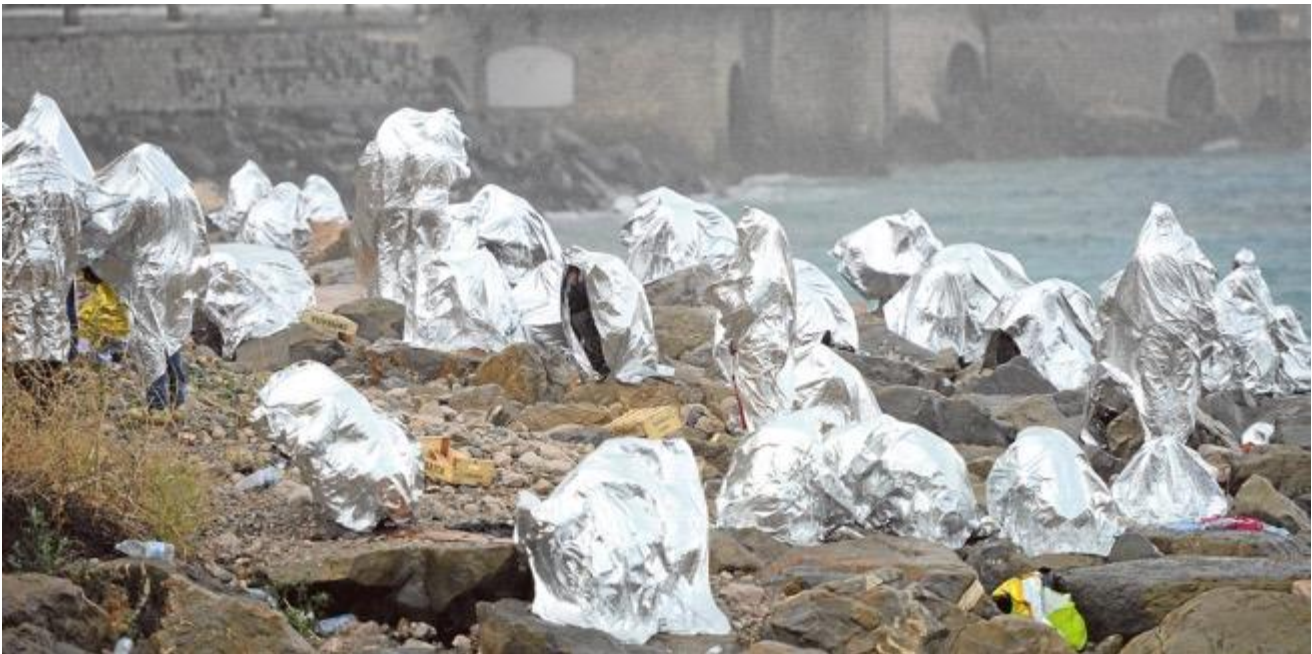
Kuva 21: Helsingin Sanomat, 23.6.2015.

henkilöistä. Helsingin Sanomissa vastaava prosenttiluku on vähemmän: noin 6 %. Kasvottomuus havainnollistaa katsojalle juurettomuutta ja identifikaation mahdottomuutta, mikä lietsoo pelkoa ja uhkaa. Kasvottomuudessa on jotakin luonnotonta. Ihmisten representointi ilman, että kasvot ovat tunnistettavissa, voidaan liittää yhteiskunnan eroihin virallisuudessa ja toisaalta valta-asemassa. Helsingin Sanomissa on esimerkiksi paljon enemmän henkilökuvia– näin ollen kuvia, joissa kasvot ovat tunnistettavasti näkyvillä. Myös kuvia tunnistettavista poliitikoista on enemmän kuin Dagens Nyheterissä. Helsingin Sanomien välittämä humanitarismi hahmottuu virallisempänä ja auktoriteettia korostavampana. Toisaalta kummassakin lehdessä on elementtejä kaikista kategorioista.