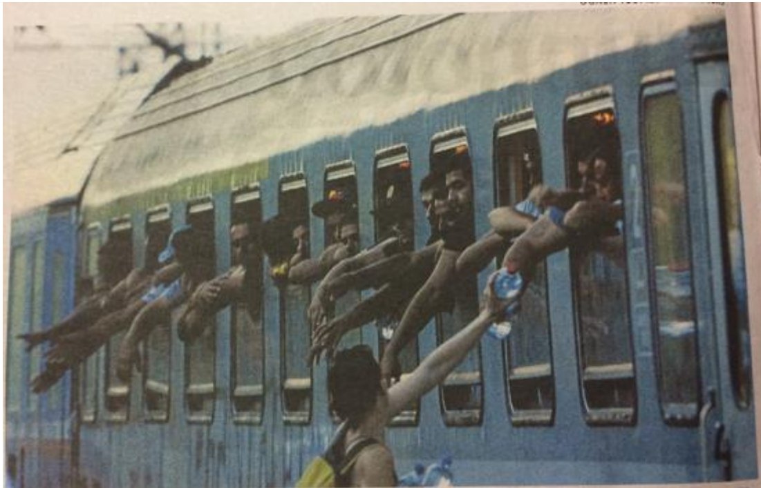
Eurooppaan haluavat siirtolaiset yrittivät saada vettä täyteen ahdetussa junassa Makedoniassa, lähellä Kreikan rajaa viime viikonvaihteessa.

enemmän. Kontekstin näkökannasta junassa tai junaraiteilla käveleminen tai oleskelu symboloivat liikettä ja matkaa ja konnotoivat levottomuutta.