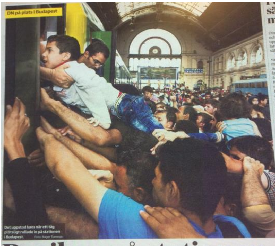
Kuva 11: Dagens Nyheter , 4.9.2015.

paljon käsiä, mutta poika on kuvassa kokonaan. Junassa hänet vastaanottaa tuntematon ihminen, josta näkyvät niin ikään vain kädet. Tämä saa katsojan pohtimaan, mihin ihmiset ovat matkalla, pääseekö poika junaan sisälle ja miksi turvapaikanhakijat tai pakolaiset haluavat juuri tähän kyseiseen junaan. Kuvakulma vahvistaa dramaattista asetelmaa. Kädet ovat kuvassa pojan lisäksi pääosassa. Kädet ovat kuin lonkeroja, jotka pyrkivät koskettamaan idoliaan tai saavuttamaan haluamansa. Kädet konnotoivat tekoja, symboloivat saavuttamista ja kosketusta. Raajoja, joiden kautta kirjoittaminen, työn tekeminen ja mielensä osoittaminen ovat mahdollisia. Tietyt sormimerkit ovat kulttuurirelativistisia, jotkut universaaleja. Esimerkiksi käsien ristiminen rukoilun merkiksi on suhteellisen universaalia. Kuvassa, jossa on massoittain käsiä, voidaan assosoida kädet jonkin konkreettisen tavoitteluun. Dagens Nyheterin massakuvassa, kuten myös muissa isoa ihmisjoukkoa kuvaavissa kuvissa, uusi ja parempi elämä ovat miltei ”käsien kosketeltavissa”. Turvapaikanhakijat ja pakolaiset pyrkivät tarttumaan kiinni elämän syrjästä keinolla millä hyvänsä, esimerkiksi menemällä junaan ikkunoista oven sijasta.