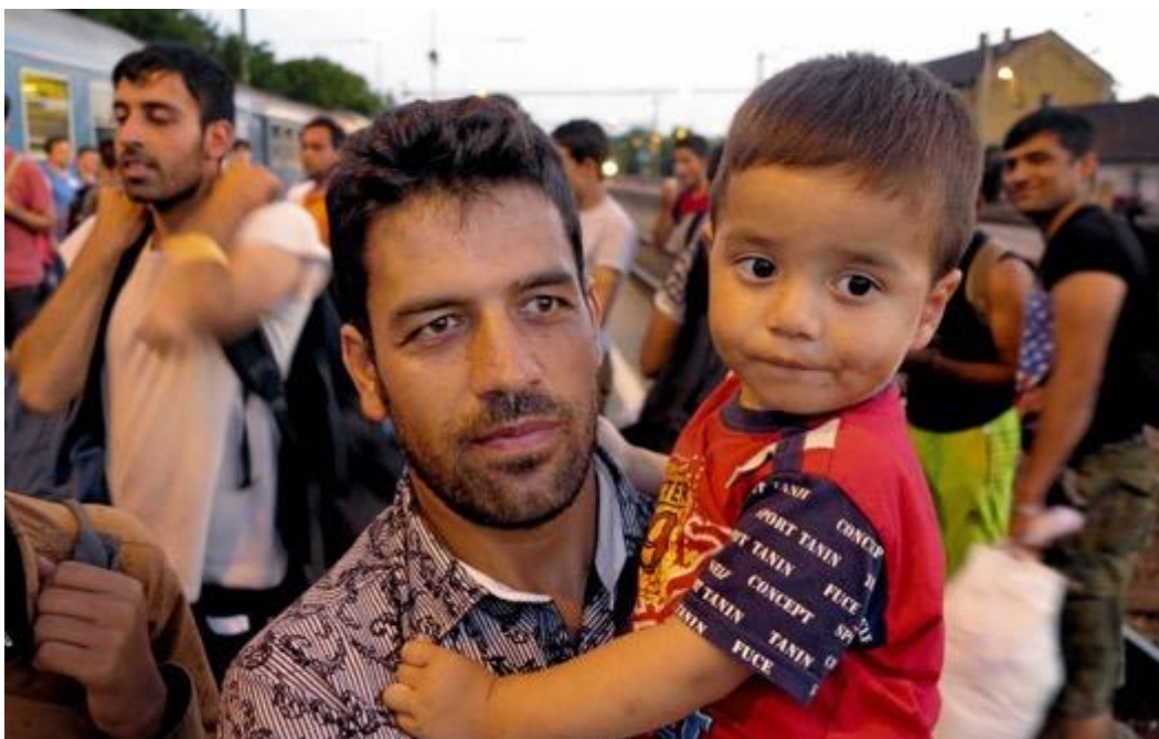
Kuva 18: Dagens Nyheter, 25.07.2015.