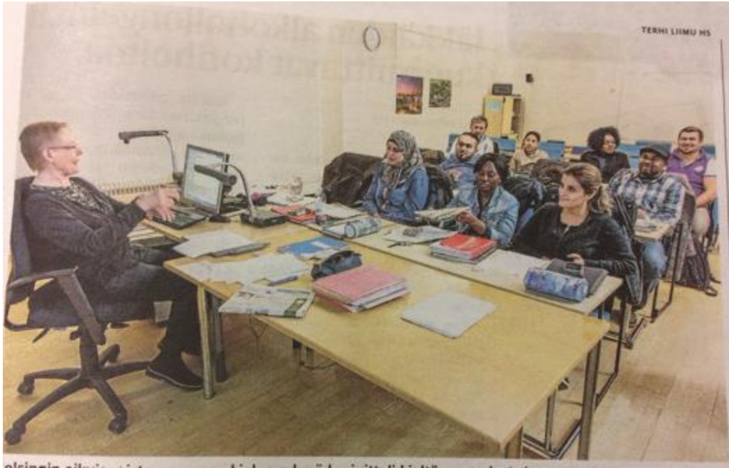
Kuva 2. Helsingin Sanomat, 26.10.2015.

Opettaminen symboloi sivistystä ja tietoa sekä sulautumista yhteiskunnan yhteiseen tietoperimään. Opetuksen voidaan katsoa olevan jossain määrin oikeus ja etuoikeus, jonka avulla turvapaikanhakijoille osoitetaan asioiden, tiedon ja itse yhteiskunnan merkitys ja jonka kautta he pääsevät osaksi yhteisöä. Molemmissa yhteiskunnissa, niin suomalaisessa kuin ruotsalaisessa, sivistys, opettaminen ja koulutus ovat suuressa roolissa. Koulutukselle ja sivistykselle annetaan painoarvoa, ja esimerkiksi Suomen koulutusjärjestelmästä ja kansainvälisistä Pisa-testin tuloksista on oltu kansallisesti ylpeitä. Opetuksen ja koulutuksen tärkeydestä kertoo myös opetuksen ja koulutuksen edullisuus ja pyrkimys taata kaikille tasapuoliset lähtökohdat. Humanitarismin kuva sivistyksen näkökulmasta on linjassa arkisuuden analyysin kanssa, erityisesti Dagens Nyhterin kuvissa, joissa myös arkisuutta konnotoivia kuvia oli enemmän kuin Helsingin Sanomissa . Opetuskuvat toisentavat suomalaista ja ruotsalaista humanitarismia sivistyksellisen tärkeyden näkökulmasta katsottuna. Esittämällä pakolaisia ja turvapaikanhakijoita opetustilanteissa, humanitarismi myötätuntoa ja tasapuolisuutta herättävänä myyttinä voimistuu.