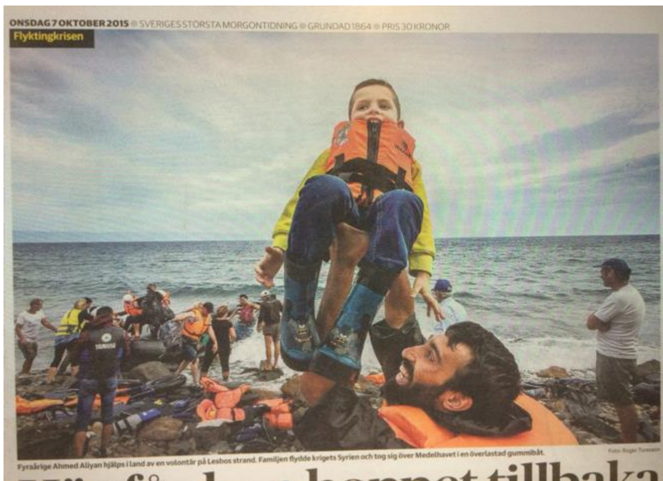
Kuva 7: Dagens Nyheter, 7.10.2015.

Pakolaisten ja turvapaikanhakijoiden reitit kulkevat usein Välimeren kautta, ja uutisointia hukkuneista on ollut koko pakolaistilanteen ajan. Meri on näin ollen ollut läsnä koko kriisin ajan. Dagens Nyheterin esimerkkikuvassa näkyvät niin ranta kuin pakolaistilanteen uutisoinnista tuttu kumivene (DN, kuva 7). Kuvassa mies nostaa kumisaappaisiin puettua lasta rannalla kohti kameraa. Molemmilla on päällään pelastusliivit ja molempien ilmeet ovat iloiset tai helpottuneet. Rantapenger on oranssinaan pelastusliivejä, joita maihin nousseet turvapaikanhakijat ja pakolaiset ovat riisuneet. Kumiveneessä on vielä ihmisiä, jotkut näyttävät yrittävän saada kumivenettä rantaan. Näiden joukossa on myös huomioliiviin pukeutunut nainen. Horisontti on kuvassa suora, pojan ja miehen ilmeet ovat nauravaiset. Poika on nostettu keskelle kuvaa tavalla, joka konnotoi uutta elämää. Aivan kuin he olisivat saapuneet turvasatamaan saapuessaan rantaan. Pieni lapsi pelastusliiveissä ja miehen helpottunut katse herättänevät myötätuntoa ja empatiaa. Rannalla makaavat tyhjästä pelastusliivit saavat katsojan kysymään, mitä muille matkustajille on tapahtunut. Selvisivätkö he merimatkasta vai ovatko pelastusliivit menehtyneiden liivejä?