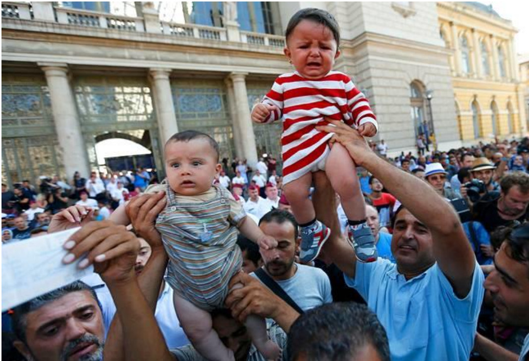
Kuva 14: Helsingin Sanomat, 2.9.2015.

Kuva itkevästä lapsesta on kouriintuntuva ja myötätuntoa herättävä. Itku konnotoi hätää ja huolta, ja sen merkitys surun, hädän ja kärsimyksen tunnetilana on universaali. Helsingin Sanomien kuva itkevästä lapsista väkijoukon keskellä (HS, kuva 14) herättää myötätuntoa ja huolta. Miehet ovat nostaneet lapset kuin voitonsaaliiksi ilmaan. He kannattelevat vauvoja muiden yläpuolella. Erityisesti punavalkoraidalliseen asuun puettu pieni vauva itkee, toinen vauva näyttää pelokkaalta ja hämmentyneeltä. Kaikki ympärillä olevat ihmiset ovat miehiä, mikä tekee kuvasta sukupuolen näkökulmasta kiintoisan. Takana oleva massa ei ole kuvassa kovin tarkka, kameran linssi on kohdistunut suoraan kahteen vauvaan. Niin suomalaisessa kuin ruotsalaisessa yhteiskunnassa sosiaaliturva on hyvin turvattua. On äitiyspakkaus, neuvolajärjestelmä ja Lastensuojeluliitto. Lasten tulevaisuus ja hyvät lähtökohdat pyritään turvaamaan. Vastaavanlaiset kuvat synnyttävät huolta ja pelkoa. Tämä rakentaa humanitarismia kulttuurierojen näkökulmasta.