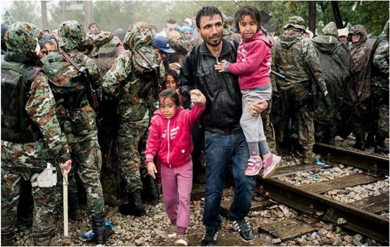
Kuva 8: Dagens Nyheter, 11.09.2015.

Kuvat juna-asemilta ja junista ovat usein kaoottisia ja tunnelma voi olla hyvinkin dramaattinen. Helsingin Sanomien kuvat junaan nousevista ja junassa olevista miehistä (HS, kuvat 9 & 10) ovat hyvin samankaltaisia. Molemmissa kuvissa on pelkästään miehiä, mikä tekee kuvista sukupuolittuneita. Kummassakin kuvassa junasta näkyvät vain ikkunat– toisessa kuvassa (kuva 9) junan ikkunat voidaan assosoida vankilan ikkunoiksi: ikkunoita on monia, useiden miesten kasvoja ei näy, vain kädet ovat näkyvillä. Toisessa kuvassa (kuva 10) miehet yrittävät junan ikkunoihin kuin väkisin. Ikkunoita on kaksi, joista toisessa on mies puoliksi ulkona sekä poika, joka pyrkii sisään junaan. Toisessa ikkunassa näkyvät vain pystyssä olevat jalat, mikä tekee kuvasta yhtäältä huvittavan ja toisaalta luonnottoman ja dramaattisen. Molemmat kuvat konnotoivat kaaosta ja epäjärjestystä. Junan ikkunaa ovena käyttävät miehet konnotoidaan johonkin laittomaan– ehkä he eivät ole esimerkiksi ostaneet lippua. Tämän vuoksi pohjoismainen myytti järjestyksen kunnioittamisesta särkyä ja kuvassa näkyvät ihmiset voidaan nähdä negatiivisessa valossa. Dagens Nyheter issä junaraiteilta otettuja kuvia on 13, ja junakuvia 29. Helsingin Sanomissa junaraidekuvia on vain 4 kun taas junakuvia on 14. Dagens Nyheter issä toisin sanoen kuvataan tässä kontekstissa olevia liikekuvia ja järjestystä konnotoivia kuvia Helsingin Sanomia