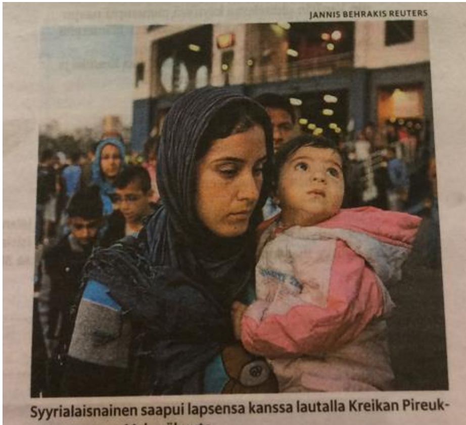
Kuva 20: Helsingin Sanomat, 11.7.2015.