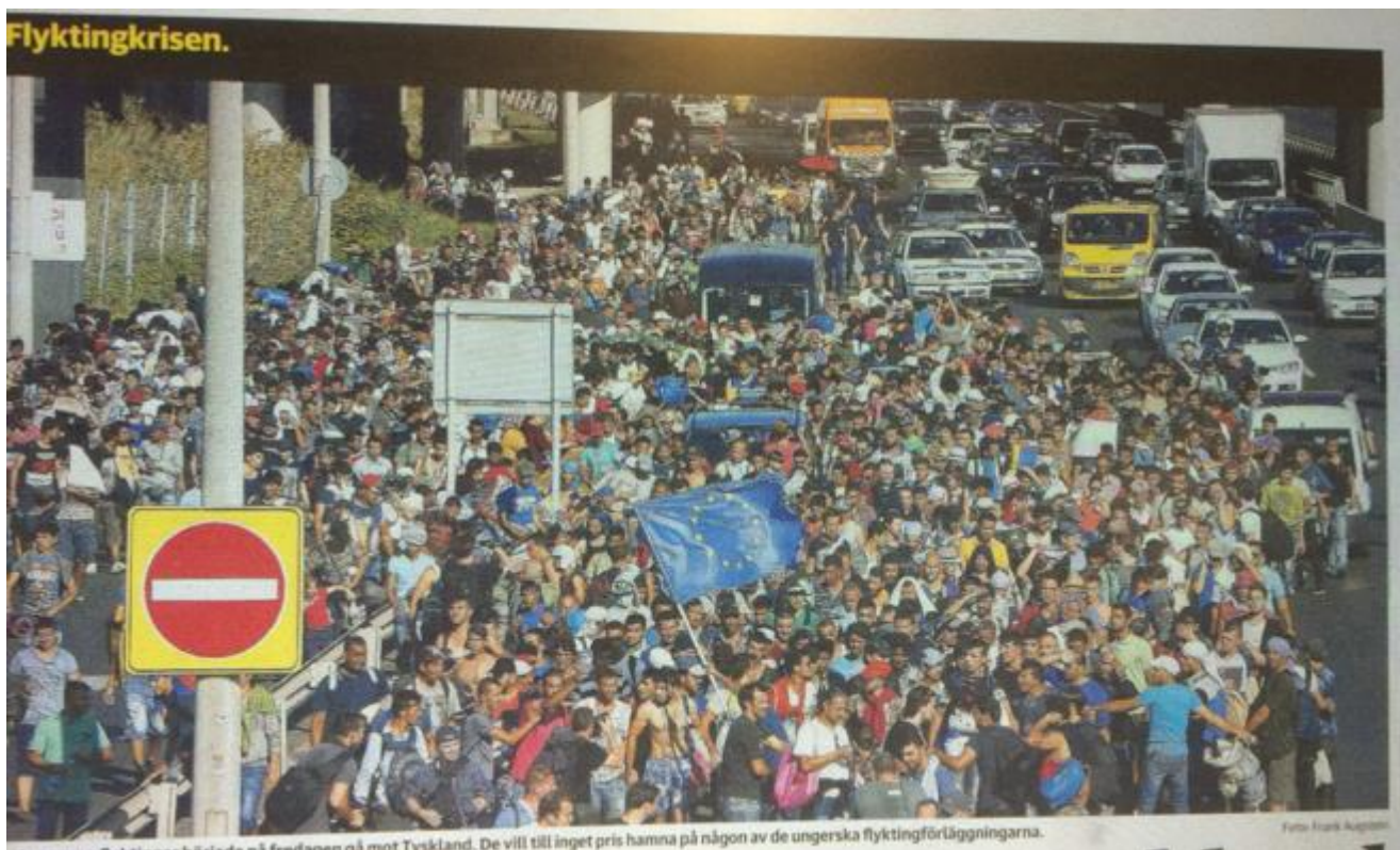
Kuva 25: Dagens Nyheter , 5.9.2015. Kuva: Frank Augstein.

Lippu ja sen kuvaaminen sisältävät hyvin vahvaa symboliikkaa. Lipun eri värit, muodot ja kuviot pitävät niin ikään sisällään symboliikkaa. Lippua pidetään arvokkaana, se nostetaan salkoon tärkeinä, surullisina ja arvovaltaisina päivinä ja siitä on tehty lukuisia lauluja. Liputus on yleistä olympialaisissa ja urheilutapahtumissa, joissa kannustetaan tietyn maan kansalaisia. Lippu assosioidaan kansallistunteeseen ja se on liitetty nationalismiin ja isänmaallisuuteen. Dagens Nyheterin kuvassa on massoittain ihmisiä autotiellä (DN, kuva 25). Huomio kiinnittyy ihmisiä enemmän liehuvaan isoon lippuun, joka on paradigmaattisesti kuvan keskellä. Lippu on Euroopan unionin sininen tähtilippu, joka symboloi EU-maiden yhtenäisyyttä. Se voidaan konnotoida myös tasa-arvoon, edistyksellisyyteen ja länsimaalaisuuteen. Tässä yhteydessä lippu voidaan nähdä eräänlaisena vaatimuksena: turvapaikanhakijat ja pakolaiset keskellä tietä kantamassa unionin lippua voi olla vaatimus paremmasta kohtelusta. Lipussa on näin ollen mielenosoituksellisuutta. Asetelma voinee konnotoida myös arvostusta, liehuva iso lippu ja erityisesti asiat, joita se symboloi, ovat jotakin mitä tavoitella.