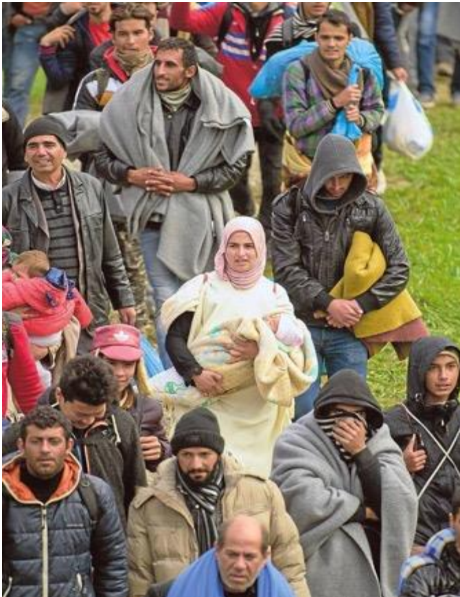
Kuva 17: Helsingin Sanomat, 24.10.2015.

Nainen valkoisessa huivissa ja asussa väkijoukon keskellä lapsi sylissään (HS, kuva 17), on paradigmaattinen valinta. Kuvan valittu kulma asettaa naisen suoraan kameran linssiin, eikä epäselvyyksiä jää kuka on kuvassa pääosassa. Nainen ja lapsi ovat keskellä kuvaa. Valkoinen huivin ja asun väri symboloi puhtautta ja neitseellisyyttä. Nukkuva lapsi sylissä, nainen on liikkeessä kohti jotakin. Nainen, joka kantaa käsivarsillaan lasta, voidaan konnotaation tasolla liittää ajatukseen äidistä, joka kantaa lasta kohdussaan. Tämä sen sijaan konnotoi turvallisuutta ja uutta elämää. Muut kuvassa näkyvät ovat miehiä. Naisen ja lapsen kuvaaminen on paradigmaattinen valinta, jota voidaan tarkastella myös syntagman tasolla. Se, että madonnamainen asetelma puhtaasta ja viattomasta äiti ja lapsi -kaksikosta asetettaa paradigmaattisesti kuvan keskelle, luo kokonaisuudeksi raamatullisuuden. Myös väkijoukosta synkkyuden keskellä voidaan löytää puhtautta ja viattomuutta. Lapsi naisen sylissä nukkuu rauhallisesti kapaloituna viltin sisällä, mikä vahvistaa kuvan madonnamaista asetelmaa. Se myös konnotoi rauhallisuutta, odotusta ja mahdollisuuksia esimerkiksi parempaan elämään ja tulevaisuuteen. Raamatullisuus, naiseuden yhteys äitiyteen, iskee siis sukupuolittuneisiin käsityksiin naiseudesta ja humanitarismista.