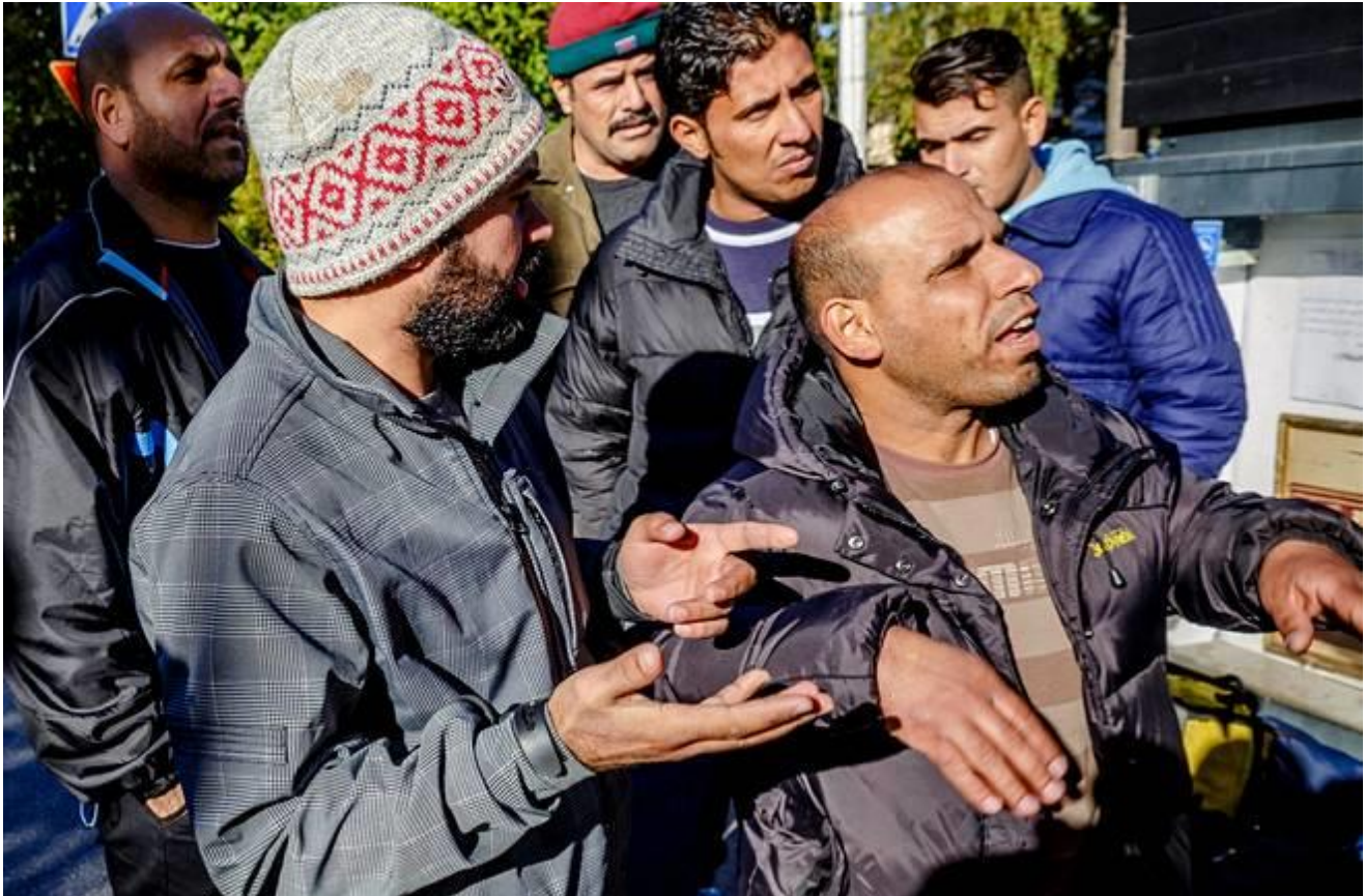
Kuva 19: Helsingin Sanomat, 8.10.2015.

Kysymyksen ja selityksen kohdetta ei ole kuvassa nähtävillä. Kuva ei varsinaisesti herätä tunteita. Se on kuitenkin hyvä esimerkki sukupuolittuneesta kuvasta, joka todentaa humanitarismimyyttiä sukupuolesta. Kuvia, joissa ihmiset ovat tunnistettavasti miehiä, on Helsingin Sanomissa 44 %. Dagens Nyheterissä prosenttiluku on noin 36 %. Tässä lehtien kuvat siis eroavat toisistaan, mikä kertoo vastakkaisista humanitarismikäsitteistä.