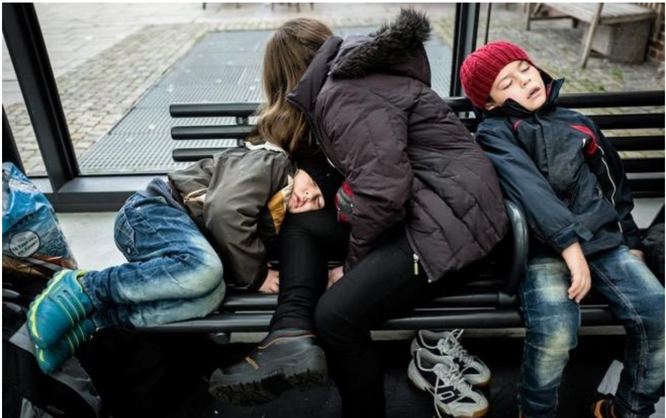
Kuva 6: Dagens Nyheter, 22.10.2015.

läsnä passiivisuutta kuvaavissa kuvissa, ihmiset ovat pysähdyksissä jossakin menneisyyden ja nykyisyyden välimaastossa. Kuvassa, jossa nainen nukkuu kahden lapsen kanssa bussipysäkillä tai penkillä (DN, kuva 6) konnotoi avuttomuutta tai hätää laiskuutta enemmän. Passiivisuus voidaan konnotoida laiskotteluun, joutilaana olemiseen. Tällöin kuvan merkitys on myötätuntoa herättävän hädän sijasta negatiivisesti latautunut. Kontrasti kuviin, joissa turvapaikanhakija tai pakolainen pyrkii aktiivisesti parantamaan asemaansa tai oppimaan yhteiskunnan jäseneksi (kuten esimerkiksi opettamista kuvaavissa kuvissa), on suuri. Passiivisuutta kuvaavia kuvia on niin prosentuaalisesti kuin lukumääräisesti enemmän kuin esimerkiksi opettamista ja leikkimistä kuvaavia kuvia. Tämä representointi rakentaa suomalaista ja ruotsalaista humanitarismikäsitystä pakolaisista negatiivisempaan suuntaan. Sanonnat, kuten ”jokainen on oman onnensa seppä” tai ajatukset ”yhteiskunnan elätistä” ovat molemmat yhteiskuntamme myyttejä. Opiskelua, veronmaksamista ja oman kortensa kantamista kehoon katsotaan hyväksi ja oikeaksi toiminnaksi. Vaikka yhteiskunta ei jätä tyhjän päälle, ajatellaan, että oikeuden ja vastuun tulee olla tasapainossa.