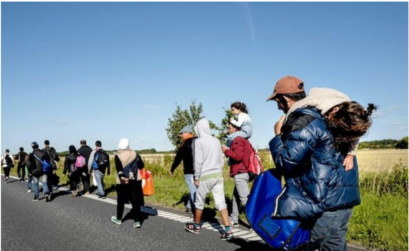
Kuva 5: Dagnes Nyheter, 9.9.2015. Kuva: Anders Hansson.

Liike voi olla myös melko passiivista, kuten kuvassa, jossa pakolaisia on jonossa tien varressa (DN, kuva 5). Kuvassa henkilöiden kasvot eivät näy ja mies kantaa poikittain olevaa lasta epätavanomaisesti harteillaan. Lapsi ikään kuin roikkuu harteilta, mikä lisää kuvan unenomaista tunnelmaa. Ihmisten liikkeet ovat tasaista vaeltamista, ympäristö on rauhallinen, näkyvissä ei ole autoja tai muuta liikennettä. Liikkumisen päämäärättömyys ja toisaalta päämääräisyys hahmottavat suomalaista ja ruotsalaista humanitarismikäsitystä, ne rikkovat järjestyksen ja hallinnan, joita pidetään yhteiskunnassamme arvokkaina. Erityisesti kuvat, joiden tunnelma on kaoottinen, ovat omiaan rakentamaan mielikuvaa laittomuudesta ja sääntöjen rikkomisesta. Helsingin Sanomissa ja Dagens Nyheterissä kuvien lukumäärä on suhteessa melko tasainen: 57 ja 66 eli 14,25 % ja 15,2 %. Tämä kertoo suomalaisen ja ruotsalaisen humanitarismimyytin samankaltaisuudesta tämän koodiryhmän osalta.