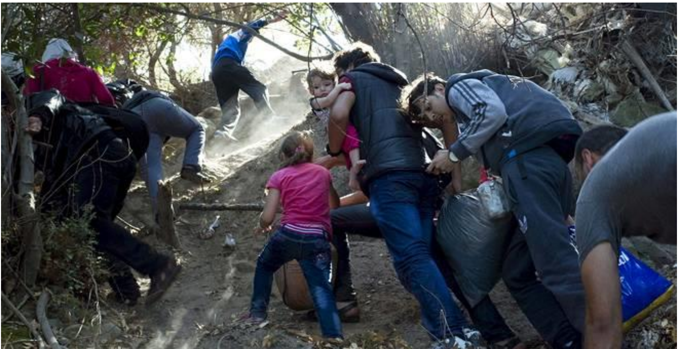
Kuva 4: Helsingin Sanomat, 12.9.2015.

Liike voi olla aggressivista tai passiivista; aggressiivinen liikkeellä oleminen voi olla esimerkiksi hyppäämistä tai ryömimistä aidan ylitse tai alitse. Esimerkiksi kuvassa, jossa turvapaikanhakijat ja pakolaiset pyrkivät ylös rinnettä (HS, kuva 4), liike on äkkipikaista ja tunnelma hätäinen. Mies kantaa lasta, jonka kasvot katsovat alaspäin kohti kameraa, muut kantavat esimerkiksi muovipusseja. He pyrkivät ylös, kohti valoa ja juoksevat pois, kuin jostakin pahasta. Monet näyttävät olevan kompastumaisillaan. Tämä rikkoo ajatusta toivotusta järjestyksestä ja herättää ajatuksen laittomuudesta. Ihmiset kuvassa ovat liikkeessä, mutta pois päin kamerasta – he eivät ole tunnistettavissa. Valo rinteen päällä symboloi uutta elämää ja kirkkautta, jonne ihmiset pyrkivät juosten, se symboloi Eurooppaa. Tämä rakentaa humanitarismparadigmaa hätäisyydestä, äkillisyydestä ja laittomuudesta.