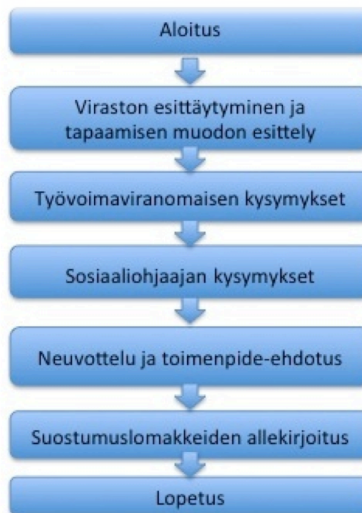
Kuvio 2. Työvoiman palvelukeskuksen ensitapaamisen vuorovaikutuksen kokonaisrakenne

Seuraavassa kuviossa tuon esille ensitapaamisten yleisen kokonaisrakenteen muodostumista. Ensitapaamisissa on aloitus ja lopetus. Näiden välillä eri osiot jakautuvat tapaamisen tarkoituksen mukaisesti. Aloituksen jälkeen viranomaiset esittelevät virastonsa ja käyvät läpi tapaamisen muotoa. Tämän jälkeen sekä työvoimaviranomaisella että sosiaaliohjaajalla on omat ennalta määritellyt kysymykset nuorelle. Viranomaisten haastattelun jälkeen siirrytään neuvottelu- ja toimenpidevaiheeseen, jossa haastattelussa saatujen tietojen perusteella tarjotaan nuorelle mahdollisesti joitain toimenpiteitä. Toimenpide-ehdotuksen jälkeen nuori allekirjoittaa tietojen vaihtoon liittyviä suostumuslomakkeita eri viranomaisten toimintaan liittyen. Tämän jälkeen tapaaminen päätetään.