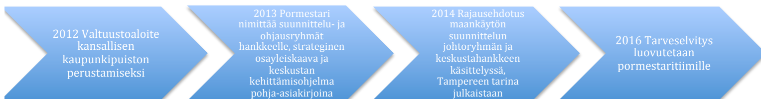
Kuvio 2: Kansallisen kaupunkipuiston suunnittelun vaiheet.