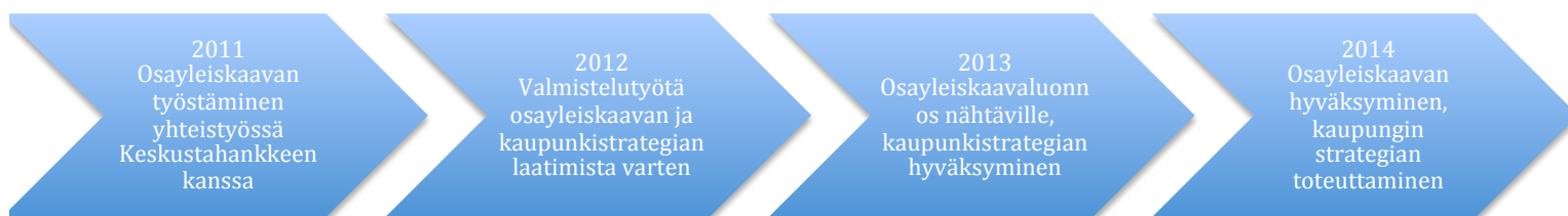
Kuvio 1: Keskustahankkeen ja kaupunkistrategian vaiheet.

Vuonna 2013 Tampereella hyväksyttiin uusi kaupunkistrategia, jota toteuttamaan laadittiin keskustan osalta Viiden tähden keskusta –kehitysohjelma. Myös valmisteilla ollut keskustan strateginen osayleiskaava asetettiin nähtäville vielä vuoden 2013 aikana. Osayleiskaavaprosessi toteutettiin tiiviissä yhteistyössä entisen, vuonna 2011 perustetun keskustahankkeen kanssa. Kansallisen kaupunkipuiston tarkastelualueen painottuessa kaupungin keskusta-alueelle, ovat keskustahankkeen ja strategisen osayleiskaavan päätökset olleet merkityksellisiä kansallisen kaupunkipuiston toteutumisen kannalta. Kaupunkistrategiassa ja osayleiskaavassa on huomioitu valtakunnallisten alueidenkäyttötavoitteiden yhteydessä merkittävät kulttuuriympäristöt, kuten koskimaisema. Rinnakkaissuunnittelulle nähtiin silti olevan tarvetta, sillä esimerkiksi osan keskustahankkeen tavoitteista ei nähty tukevan kansallisen kaupunkipuiston toteutumista. Sekä keskustahanketta että kansallisen kaupunkipuiston suunnittelua yhdistää lisäksi monihallinnollinen työskentely.