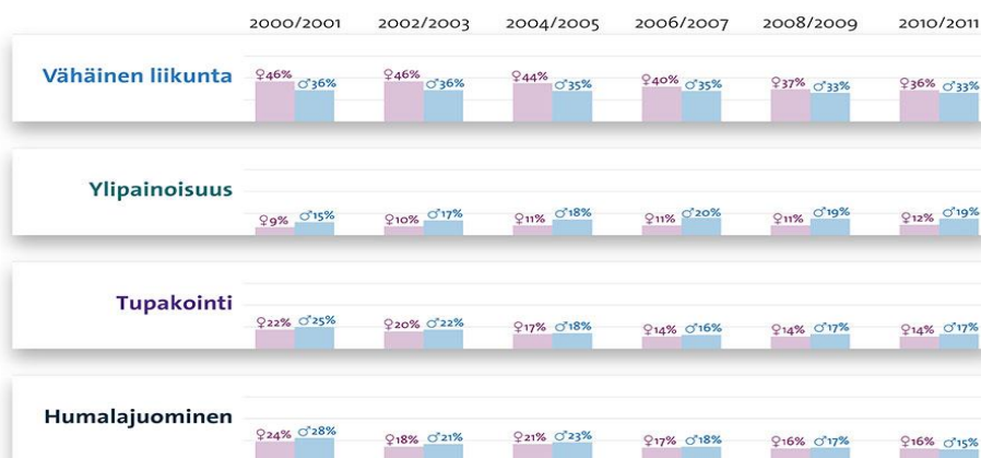
Kuvio 3. Erot yläluokkalaisten tyttöjen ja poikien elintavoissa (Kouluterveyskysely 2013 b).