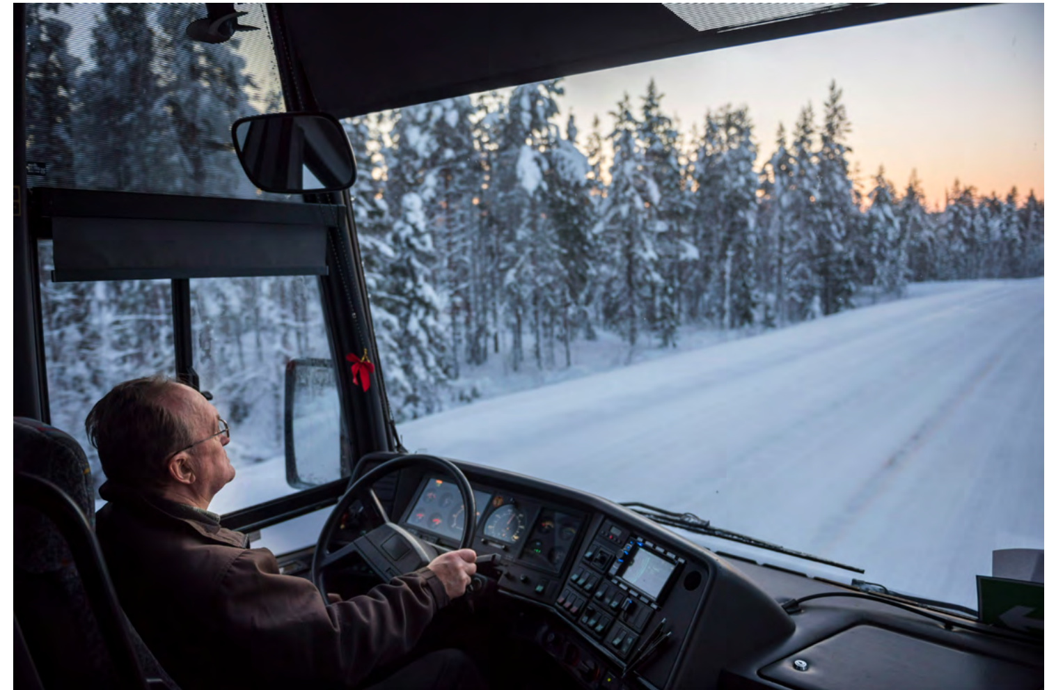
Linja-autonkuljettajista on Suomessa pulaa. Asiaan saattavat vaikuttaa esimerkiksi ammatin työajat.

Työntekijät myös koulutetaan kuljetusala tehtäviinsä, mutta riittävä suomen kielen