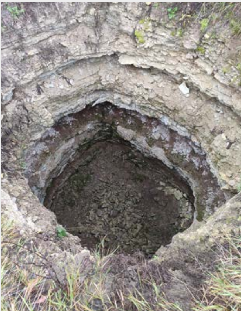
Figura 3: Ejemplo de hoyo minero.