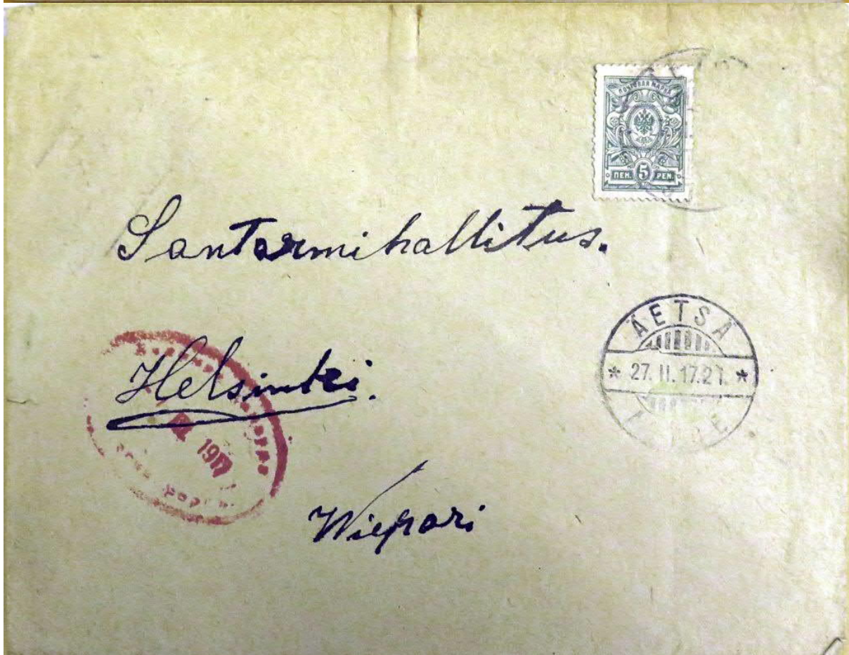
Santarmihallinnolle lähetettyjen ilmiantojen kuoria helmikuulta 1917.