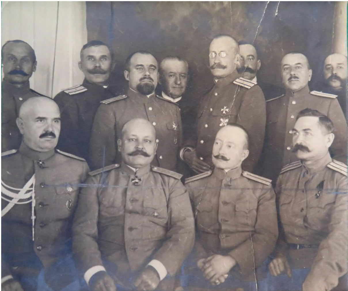
Suomen santarmihallinnon piiri- ja aluepäälliköitä ensimmäisen maailmansodan